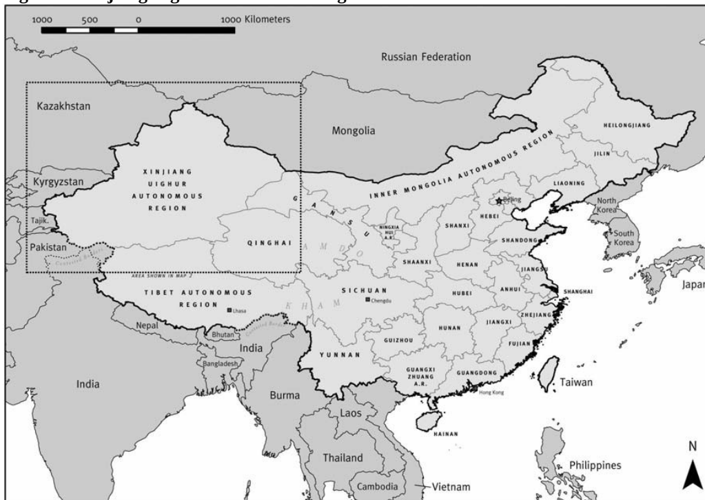
Map 1: Provinces and Autonomous Regions of the People's Republic of China

De Chinese overheid wordt geleid door de Chinese Communistische Partij; dit is de enige partij in het land die regeert. Deze bestaat op een enkele uitzondering na uit Han-Chinezen, de dominante etnische groep in China. 15 De Chinese Communistische partij heeft sinds de annexatie economische en politieke controle over de provincie