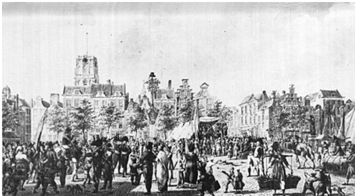
Afbeelding 2. Het werven van matrozen voor de marine in 1795 op de Grote Markt te Rotterdam. In het midden de vrijheidsboom, rechts het standbeeld van Erasmus, op de achtergrond de St. Laurens. 23

Voor een beter begrip van de omstandigheden die hebben geleid tot de invoering van de dienstplicht, hierna conscriptie, wordt in dit hoofdstuk de periode 1795-1813 besproken. Er waren in deze periode tal van wijzigingen in het staatkundig bestel van Holland en veranderingen in de marine, mede door de invoer van nieuwe wetten voor de marine. Deze ontwikkelingen hadden gevolgen voor het bestuur van de marine, de activiteiten van de marine en het korps zeeofficieren. Op bestuurlijk gebied gaat het over de vormgeving van de hiërarchie binnen de marine, terwijl bij de veranderingen in het korps zeeofficieren bovenal de reactie op deze veranderingen centraal staat. Gedetailleerd onderzocht wordt de vormgeving van de maritieme inscriptie en welke wetten daar aan ten grondslag lagen.