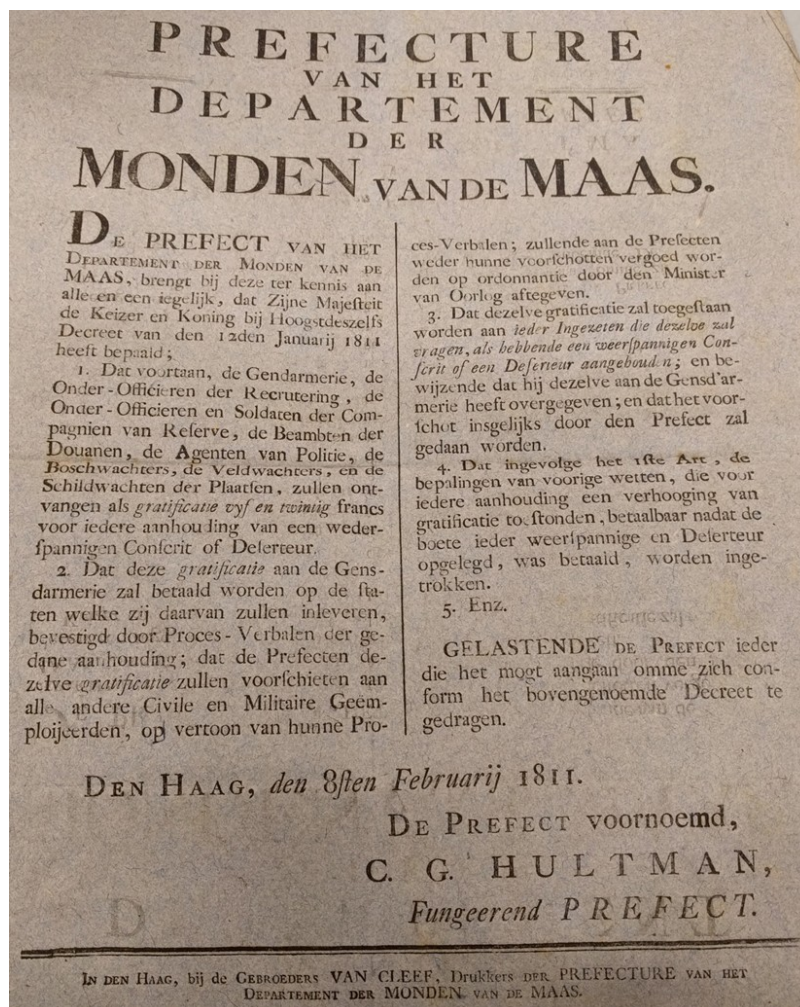
Afbeelding 5. Pamflet met daarop de beloning die stond op het aangeven van een deserteur. Al snel na de inlijving werd deze verhoogd van twaalf naar 25 franc. 126

In het voorgaande hoofdstuk is de uitvoering van de conscriptie en de maritieme inscriptie in Holland en in detail de Monden van de Maas aan bod gekomen. Het is gebleken dat bij de conscriptie de uitvoering goed uitgewerkt was. Terwijl bij de maritieme inscriptie de uitvoering daarvan niet zo goed was uitgekristalliseerd. De absolute aantallen bij de conscriptie zijn daarom veel beter te achterhalen dan bij de maritieme inscriptie. Ook was de kans om opgeroepen te worden bij de maritieme inscriptie voor de zeelui een stuk hoger dan bij de conscriptie.