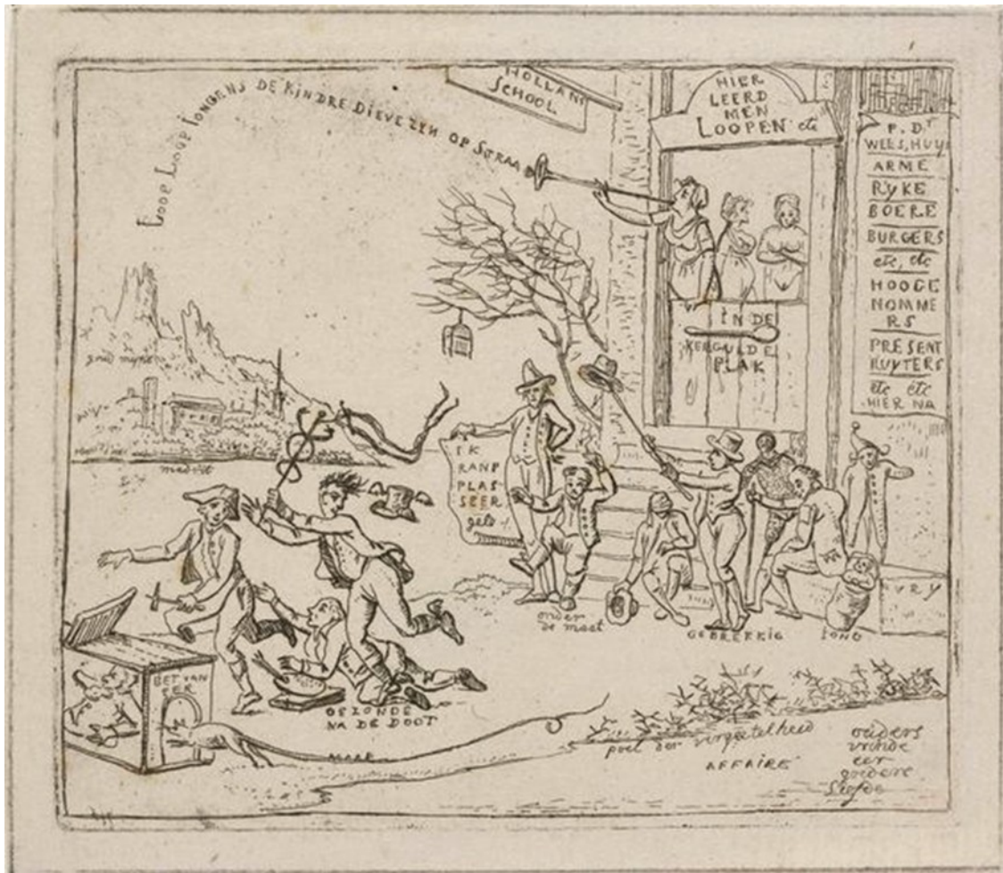
Afbeelding 4. Spotprent op de conscriptie van de Hollandse boerenzonen voor het Franse leger. Voor een huis met het uithangbord: Hollandse school hebben zich oude en kreupele mannen en kinderen verzameld. Een vrouw waarschuwt voor kinderdieven. De geschikte jonge mannen vluchten voor de conscriptie ambtenaren van het Franse leger. Bij de trap staat een remplaçant met een brief waarop staat 'ik ranpplasseer, get'. 94

In het vorige hoofdstuk zijn de belangrijkste veranderingen in Holland en in de marine van Holland aan bod gekomen. Tevens is de Franse wet die de basis vormde voor de maritieme inscriptie in Holland onderzocht. In dit hoofdstuk worden de conscriptie voor de marine en de maritieme inscriptie in het departement van de Monden van de Maas behandeld. Dit hoofdstuk geeft antwoord op de vraag hoe de Franse wet in Holland van 1811 tot 1813 werd geïmplementeerd en hoe de wet werd uitgevoerd in het departement van de Monden van de Maas. Nader onderzocht wordt de uitvoering van beide lotingen voor de marine en de regels rondom de maritieme inscriptie in het