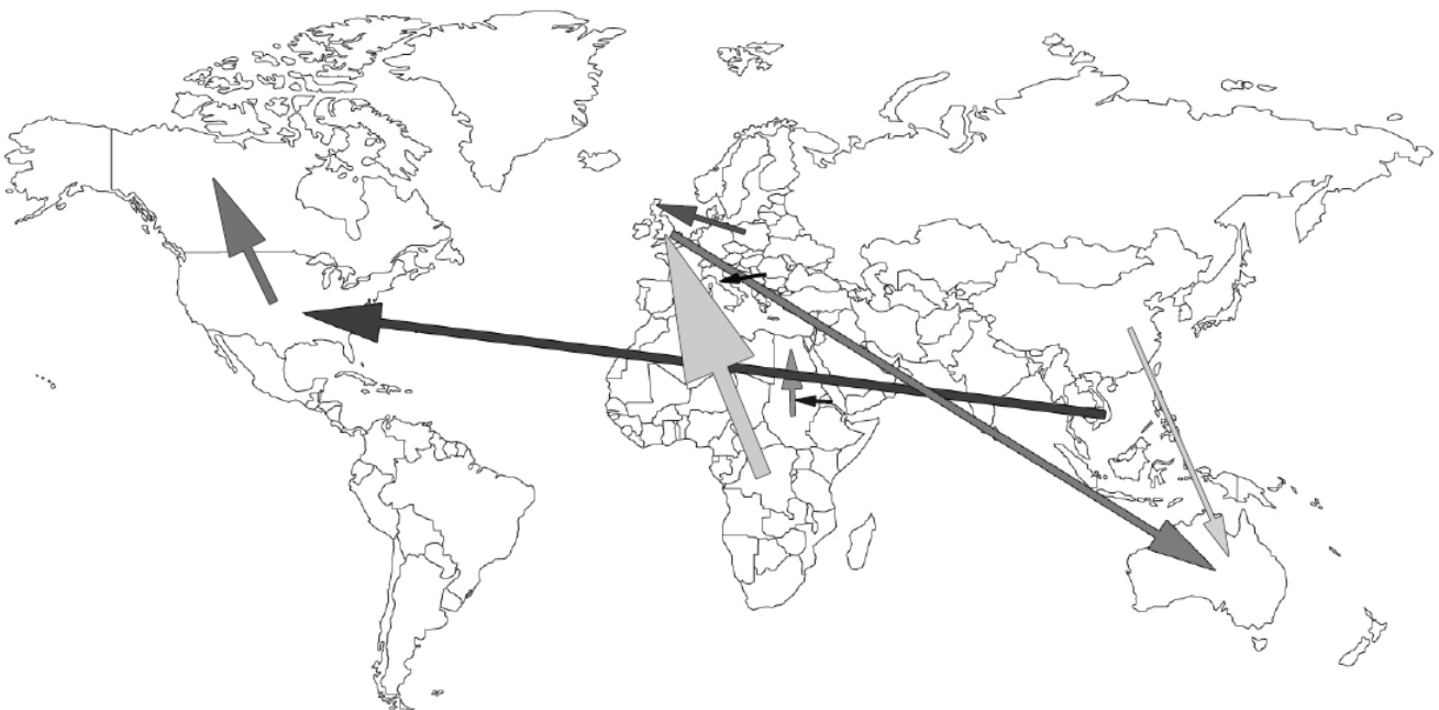
Figuur 2 12

Het casusmateriaal dat is geanalyseerd, bestaat uit vijf casussen met betrekking tot vluchtelingen en vier casussen met betrekking tot migranten. Elke casus zal in paragraaf 2.1 kort besproken worden. De casussen zijn geselecteerd omdat zij alle als onderwerp migranten of vluchtelingen hebben en ingaan op identiteitskwesities en/of het hervinden van belonging. Daarbij is er op gelet dat de artikelen niet naar elkaar verwijzen, zodat er gebruik gemaakt zou worden van losstaande casussen. Als laatste is er op gelet dat de casussen ook geografisch verspreid zijn (figuur 2), zodat er een zo divers mogelijk beeld geschetst kan worden, zie hiervoor . Dit is wellicht een valkuil geweest, omdat de situaties die omschreven zijn zeer divers zijn en er daarom wellicht veel meer casussen nodig zijn om iets te kunnen zeggen over dit onderwerp. Het doel van deze scriptie is echter om iets algemeen te kunnen zeggen over het verschil in het hervinden van belonging tussen migranten en vluchtelingen. Dit is niet mogelijk als het literatuuronderzoek zich op een specifieke regio richt, dus is er voor gekozen toch een klein aantal maar zeer diverse casussen te behandelen.