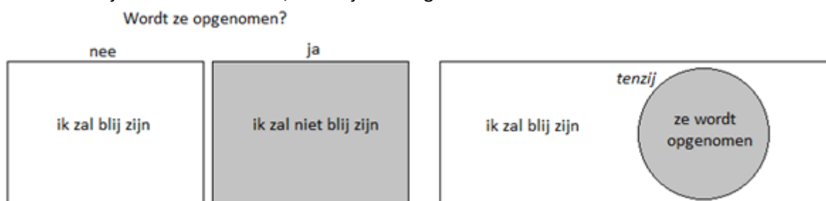
Figuur 1. Verwachte blijdschap is wit, het tegendeel is grijs. In het eerste geval wordt blijdschap voorwaardelijk verwacht indien ‘ze’ niet wordt opgenomen (mentale ruimte ingeleid met ‘als niet’). Wordt ze toch opgenomen, dan is van deze verwachte blijdschap geen sprake (mentale ruimte

Goedbeschouwd is deze persoon dus blij in de toekomst, tenzij daarop een specifieke uitzondering wordt gemaakt door het ziekenhuisbezoek. Degene die (12a) uit, verwacht alleen voorwaardelijk eventuele blijheid in de toekomst, namelijk in het geval dat ze niet naar het ziekenhuis moet.