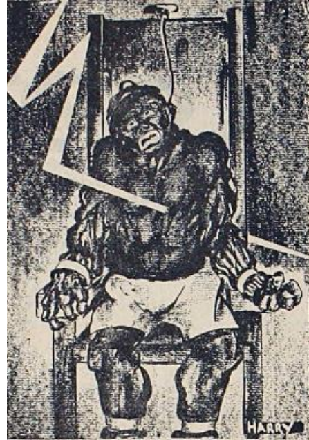
Afbeelding 8: Roode Hulp, 1931.

Gedurende de hele campagne werd door gruwelijke beschrijvingen en beelden getracht het lijden van de Scottsboro-jongens de huiskamer van de Nederlandse communist binnen te halen. In de brochure Zevenvoudige moord te Scottsboro van mei 1932 werd de lezer uitgenodigd zich zo levend mogelijk voor ogen te nemen wat de jongens te wachten stond. De elektrische stoel, zo werd uitgelegd, was een metalen stoel die door elektrische geleiding aan een hoogspanningskabel verbonden werd. Eerst werd het slachtoffer vastgebonden op de metalen stoel. Een knop werd omgedraaid die de stoel onder stroom zette. Zodra dit gebeurde kromde ‘het lichaam zich meteen in doodstuip’.