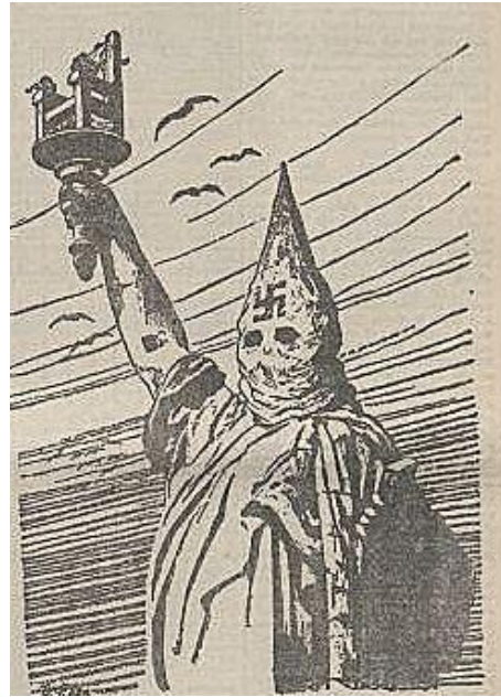
Afbeelding 9: De Tribune, oktober 1932.

In Links Richten stond in het negernummer van mei 1933 een door een onbekende auteur geschreven stuk met de sarcastische titel ‘gerechtigheid in gods own country’. De lezer kreeg eerst een stukje geschiedenis voorgeschoteld. Volgens de schrijver waren ten gevolge van de economische omstandigheden de negers van Noord-Amerika in 1867 wettelijk als vrije burgers erkend. Onmiddellijk daarop werd door ‘de slavenhouders en hun aanhang’ de Klux Klux Klan gevormd, ‘die enkel ten doel had de minderwaardige positie van de negers te bestendigen’. Volgens de schrijver bewees de Scottsboro-zaak maar weer eens hoe machtig de invloed van de Klux Klux Klan nog was, want zij hadden