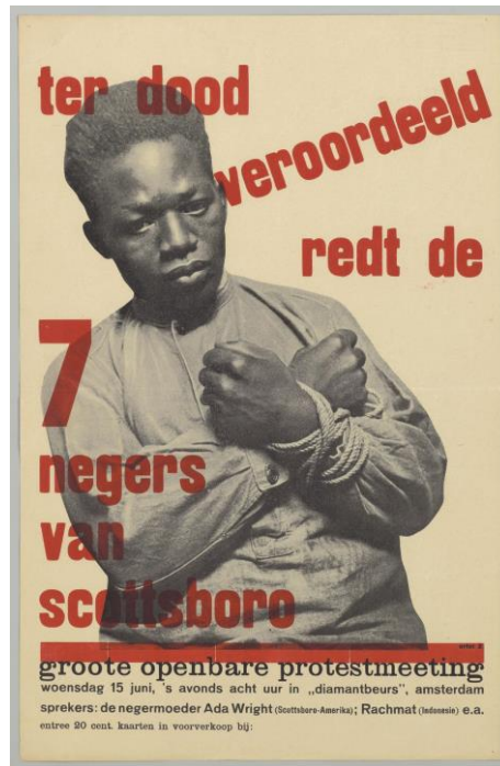
Afbeelding 5: Aankondiging van de bijeenkomst met Ada Wright in de Diamantbeurs op 15 juni 1932.

Van demonstratie, colportagetochten en brochures tot aan een eindeloze stroom berichten in de krant en een heus lied: als Nederlandse communist was het begin juni 1932 onmogelijk om ongeïnformeerd te zijn over de Scottsboro-zaak. In één maand tijd was er in Nederland een zeer omvangrijke campagne van de grond gekomen. Men was er klaar voor toen Ada Wright op dinsdag 14 juni rond het middaguur in Nederland arriveerde. Volgens De Tribune verzamelden duizenden Amsterdamse arbeiders zich de volgende avond voor de Diamantbeurt op het Weesperplein om haar te horen spreken. De zaal zou barstensvol hebben gezeten toen Wright onder de melodie van De Internationale de zaal betrad. De krant wist het moment met gevoel voor drama te beschrijven: