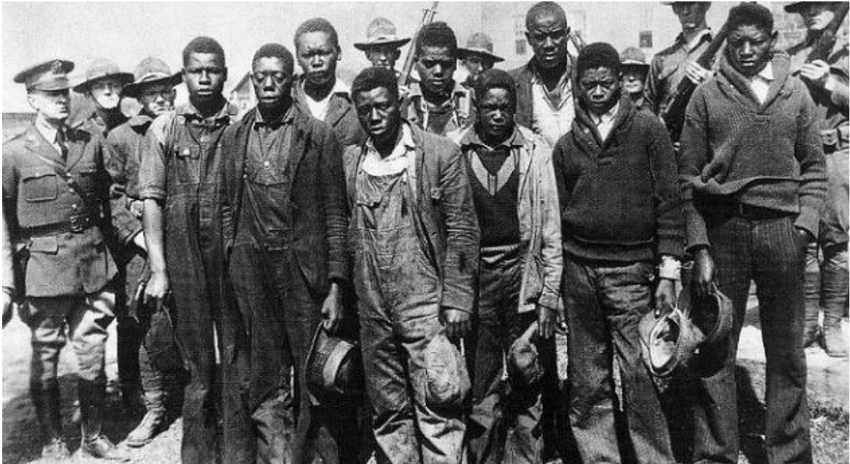
Afbeelding 1: De Scottsboro-jongens onder bewaking in Decatur, 1931.

garde te hulp en deze zorgde er met genoeg mankracht voor dat niemand naar binnen kon komen. 16 De jongens werden inmiddels in de lokale kranten de ‘nine negro brutes’ genoemd. 17