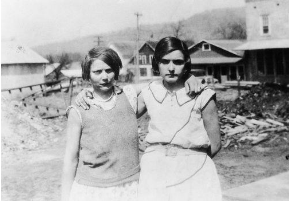
Afbeelding 2: Victoria Price en Ruby Bates, 1931.

vrouwen het zich alleen konden veroorloven om in de zwarte wijk van de stad te wonen. Price was al twee keer getrouwd en vanwege overspel en landloperij voor straf naar een werkhuis gestuurd. Het was een harde vrouw. Ze praatte hard, kauwde tabak en had een vechtersmentaliteit. Ruby Bates was heel anders: als ze al praatte dan deed ze dat zacht. Het was een vriendschap waarin Price haar vriendin Bates volledig domineerde. 19