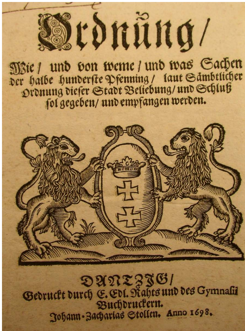
Afb. 1. Bekendmaking van de halve honderdste penning. De tweehonderdste penning moest geheven worden over alle vermogens, goederen, koopwaren, uitstaande schulden en andere waardevolle eigendommen van iedere burger en inwoner, vreemden en factours die het hele jaar door in de stad verbleven niet uitgezonderd. NA, SG, 1.01.02, inv. nr. 7325.

deze discussie zich bovendien af in een context van constante oorlogsdreiging en enorme financiële problemen voor de stad; het maakten de situatie en de onderlinge verhoudingen nog complexer. Van zowel Toorn, Graudenz, Culm en Elbing werden door het Zweedse leger hoge contributies geëist, sommige steden werden zelfs geplunderd. 147