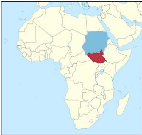
Figuur 2 (TUBS 2011). De staat Zuid-Soedan (rood) en de staat Soedan (blauw) op de kaart van Afrika.

Op 9 juli 2011 werd Zuid-Soedan onafhankelijk van Soedan (figuur 2). Na een referendum waarbij 99% van de Zuid-Soedanese bevolking voor de onafhankelijkheid stemde, was 's werelds nieuwste staat geboren (United Nations 2011). Na decennia van oorlog tussen de rebellenlegers van Zuid-Soedan en de regeringstroepen van Soedan en de rebellenlegers onderling, waren de verwachtingen in Zuid-Soedan met de vorming van een nieuwe staat hooggespannen. Al snel bleek dat de vorming van deze nieuwe staat minder soepel verliep dan gehoopt (BBC 2012). Vrijwel de gehele Zuid-Soedanese economie is gebaseerd op de opbrengst van oliebronnen, maar voor de olietransport is Zuid-Soedan afhankelijk van de havens in Soedan (Martin-Kessler & Poiret 2013). Na conflicten tussen Zuid-Soedan en Soedan over de kosten van de doorvoer van olie kwam de olie-export, en daarmee ook de economie van Zuid-Soedan, stil te liggen (Shimanyula 2012, p.127).