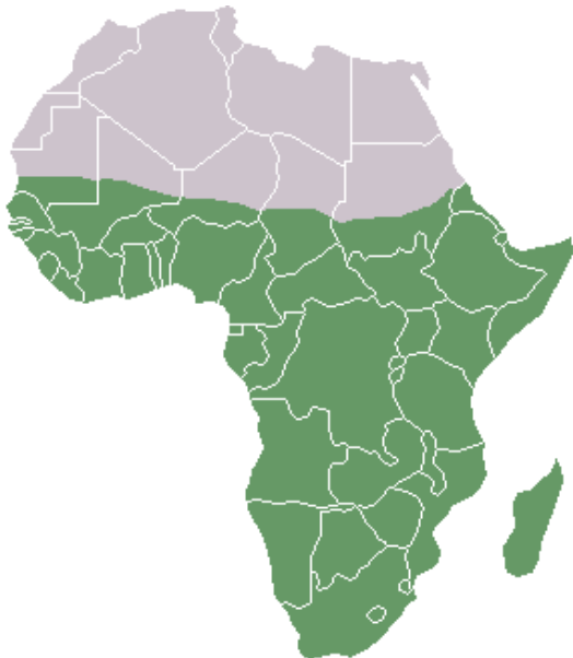
Figuur 1 (Ezeu 2011). Sub-Sahara-Afrika (groen) op de kaart van Afrika.

Sinds de dekolonisering heeft een groot aantal staten in Sub-Sahara-Afrika te maken gehad met burgeroorlogen. Met Sub-Sahara-Afrika worden de Afrikaanse landen bedoeld die ten zuiden van de Sahara liggen (figuur 1). Een veel genoemde verklaring voor onrust en conflict is het feit dat grenzen van staten in Sub-Sahara-Afrika vaak dwars door etnische groepen heen snijden (Englebert 2000, p.23). Grenzen van staten in Sub-Sahara-Afrika zijn een erfenis uit de koloniale tijd waarin het Afrikaanse continent onder Europese grootmachten verdeeld werd. Staten met zowel een grote etnische diversiteit als een hoge bevolkingsgroei zijn vaak het toneel van conflict (Green 2007, p.717).