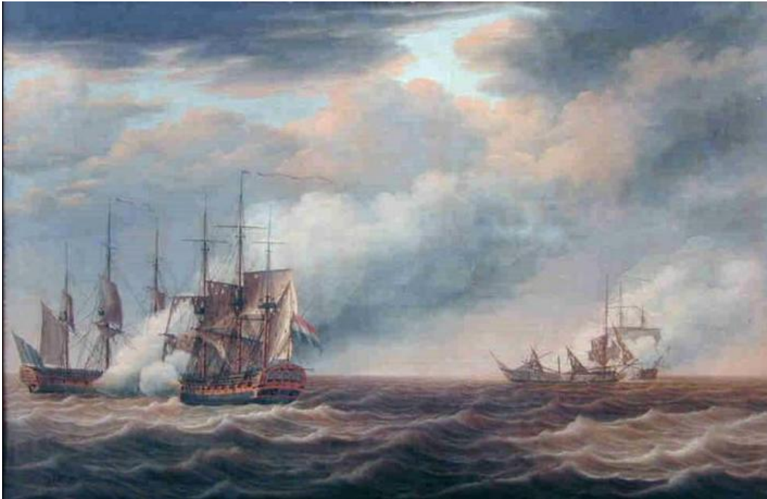
Figuur 1: De fregatten Castor en Briel in gevecht met de Engelse fregatten Crescent en Flora bij Cadiz, 30 mei 1781. Schilderij van E. Hoogerheyden, ca. 1791. Nederlands Scheepvaartmuseum, Amsterdam. De Castor (onder Pieter Melvill) bevindt zich waarschijnlijk in de achtergrond aangezien zij door de Flora flink werd beschadigd, maar haar zusterschip Briel geeft een impressie van de bouw en tuigage van een marinefregat in de jaren 1760 en 1770.