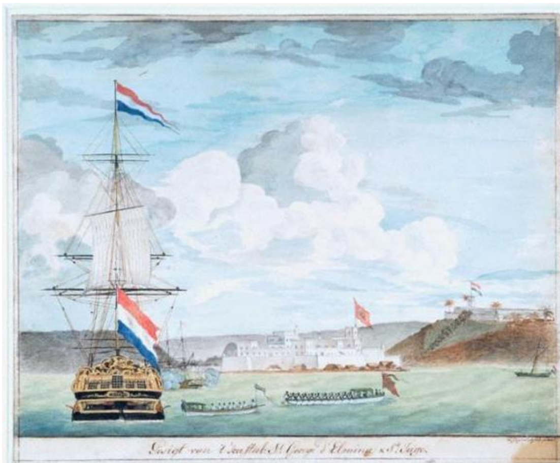
Figuur 2: De Boreas op de rede van Elmina, 1771. Tekening van Fredrik Jägerschöld, ca. 1771. Nederlands Scheepvaartmuseum, Amsterdam.