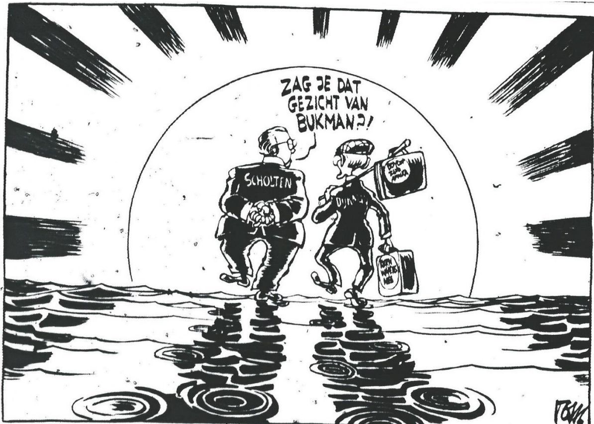
Figuur 3, Scholten en Dijkman, op de koffers van Dijkman staan de punten boycot Zuid-Afrika en kernwapens nee. Dit waren punten waarbij de twee afweken van het fractiestandpunt. (Bron: Trouw 9 december 1983)

partijprogramma hielden. Nijpels (VVD) zei dat de uittreding geen gevolgen had voor het kabinet. Den Uyl (PvdA) steunde Scholten en Dijkman. Den Uyl meende dat het vertrek grote draagwijdte had en hoopte op een begin van het einde van het CDA. 81