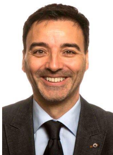
Meest mannelijke politicus (mediaan 8)