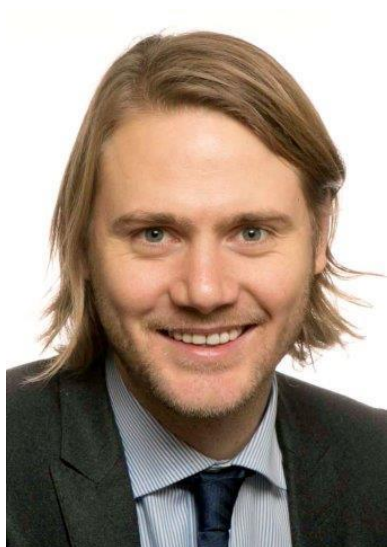
Minst mannelijke politicus (mediaan 6)