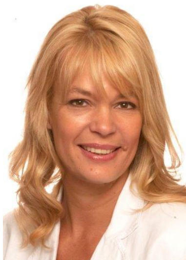
Meest vrouwelijke politica (mediaan 8)