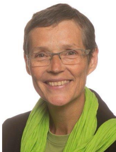
Minst vrouwelijke politica (mediaan 4)