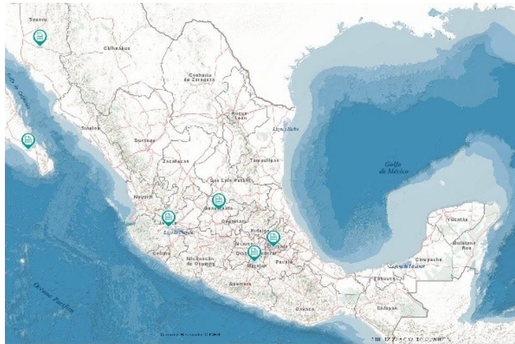
Figuur 4: kaart van Mexico

De overige staten hadden er geen moeite mee. Wat opvalt, is dat de staten die zich tegen de wet voor het homohuwelijk keerden, zich bijna allemaal bevinden in het voormalige gebied van de Azteken, waar homoseksualiteit toentertijd als iets slechts werd gezien. Hoewel het Federale District ook in dat gebied ligt, is het logisch dat homoseksualiteit daar wel meer wordt geaccepteerd, aangezien er veel migratie is en dit gebied meer in aanraking komt met internationale invloeden.