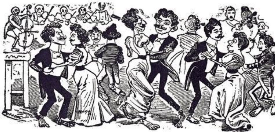
Figuur 2: Los 41 Lagartijas door José Guadalupe Posada (Berdecio, Appelbaum, 2012: 127)

Een heel bekend voorbeeld van het proberen te controleren van seksuele minderheden is 'het bal van de 41'. Dit gebeurde op 20 november 1901 en was een inval van de politie op een bal waarbij 42 mannen, verkleed als vrouw, werden gearresteerd (Mc Manus, 2013). Dit werd door de media weergegeven als een enorm schandaal en wordt gezien als een belangrijk punt, omdat Mexico hier voor het eerst echt bewust werd van de homoseksualiteit in het land. Van de 42 mensen die gearresteerd werden, werden er 41 veroordeeld en gedwongen tot het schoonvegen van de straten in hun jurken. Hierna werden de mensen die jurken hadden gedragen naar Yucatán gebracht waar ze het leger moesten helpen, de rest werd gevangengezet. De kunstenaar José Guadalupe Posada maakte het kunstwerk de '41 lagartijas' of de '41 hagedissen'. In figuur 2 is dit kunstwerk afgebeeld.