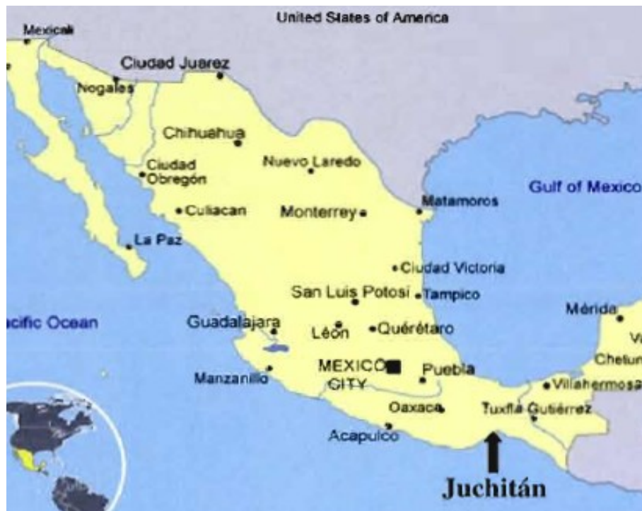
Figuur 1: leefgebied van de Zapoteken (Gauvin, 2011: 232).