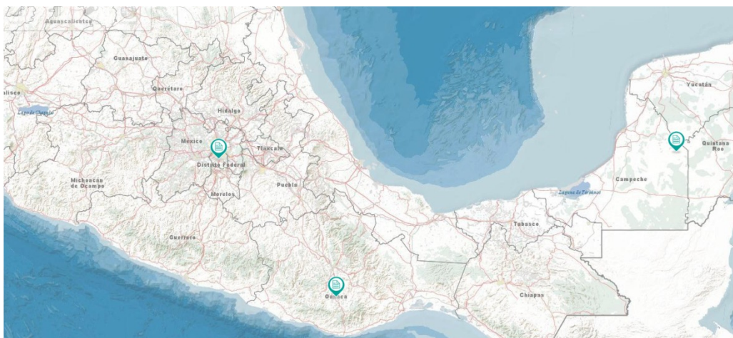
Figuur 3: kaart van Mexico (INEGI, 2014)

Om te kijken of de inheemse stammen invloed hebben gehad op de hedendaagse kijk op homoseksualiteit is het ten eerste van belang om de stammen te lokaliseren. In figuur 3 is een deel van de kaart van Mexico te zien, met drie aanwijspunten in het blauw. De meest linkse op de kaart geeft Mexico-Stad aan, waar de Azteken zich bevonden. Het middelste aanwijspunt geeft Oaxaca weer, waar de Zapoteken hebben geleefd en het meest rechtse punt bevindt zich in het voormalige gebied van de Maya's