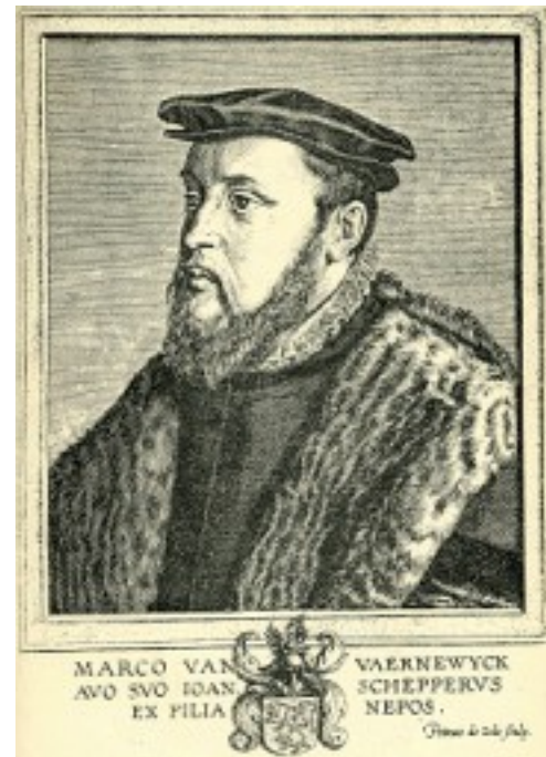
Afbeelding 8. Portret van Marcus van Vaernewijck.

Ook Marcus van Vaernewijck heeft een divers oeuvre nagelaten, welke nóg imposanter is dan die van Reael. Veel van zijn werk is in de loop der jaren verloren gegaan. 118 Zodoende zijn er van zijn gedichten slechts enkele nog bekend, die als onderdeel van een groter werk bewaard zijn gebleven. Naast poëzie heeft hij zich ook gewaagd aan het schrijven van historisch proza. Deze richtte zich veelal op Vlaanderen. Het voor dit onderzoek meest belangrijke werk hiervan is Van die beroerlicke tijden in die Nederlanden en voornamelijk te Gent 1566-1568 , waarin wordt geschreven over de politieke en religieuze gebeurtenissen van juni 1566 tot november 1568 in Gent. 119 Veel