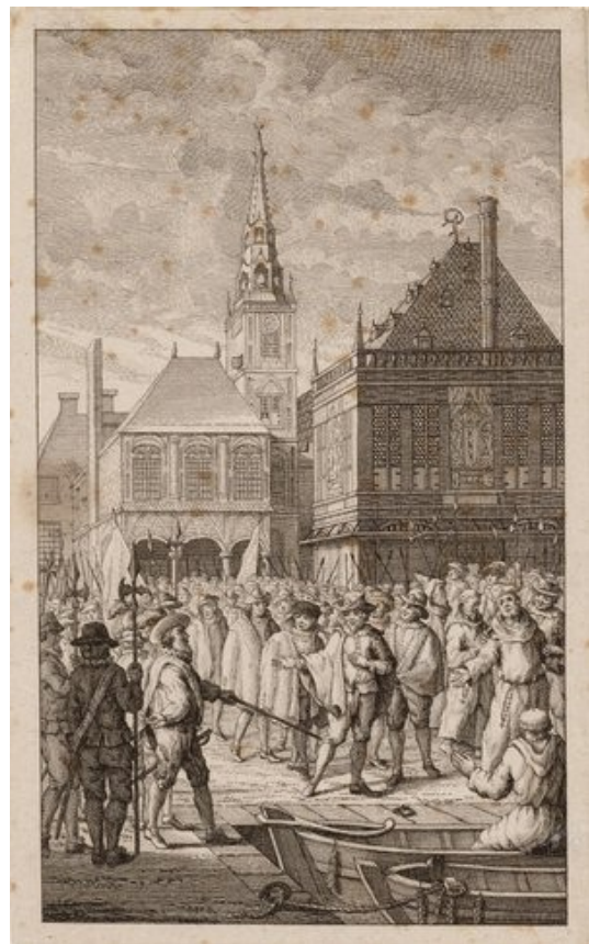
Afbeelding 6. Uitzetting der regering en geestelijkheid uit Amsterdam. Anonieme prent.

Deze situatie, waarin Amsterdam trouw bleef aan de Spaanse soeverein en de meeste protestanten de stad waren ontvlucht, zou nog tot 26 mei 1578 duren. Op die dag liepen besprekingen in Amsterdam tussen de burgemeesters en de leiders van de Republiek in het honderd. De schutterijen, gesteund door de Staten van Holland en de prins van Oranje, liepen het stadhuis binnen en arresteerden in naam van het algemeen belang de stadsbestuurders. Hierna leidden ze hen over het Damrak, waar het gewapende volk zich inmiddels had