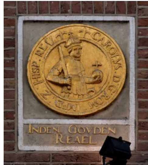
Afbeelding 1. In 1648 liet de familie Reael aan de Zandhoek op het Realeneiland een haringpakkerij bouwen, met op de gevel een plakkaat, dat nog altijd herinnert aan de naamgeving van de familie.