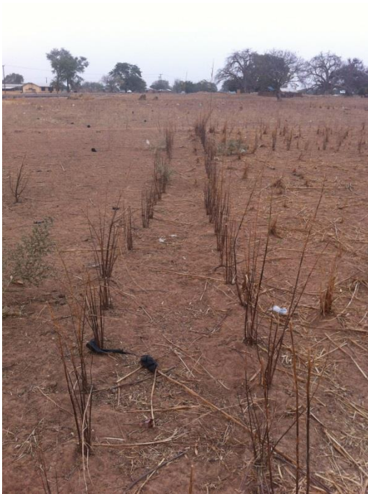
Grensmarkeringen in Tongo door middel van gewassen.

Omdat herverdeling van het land, bijvoorbeeld na een overlijden of wanneer mensen een stuk land nodig hebben, heel gebruikelijk is, zijn er in Tongo weinig afbakeningen door muren of hekken. Mijn informanten stelden dat het bezit van grond flexibel is en moet zijn. Hierdoor is het voor een buitenstaander onduidelijk welk land bij welke familie hoort, al is de familie die in het dichtstbijzijnde huis of compound woont vaak een goede gok. De meest voorkomende methode om toch een grens aan te geven is door middel van paadjes tussen de verschillende stukken land. Soms zijn deze paden duidelijk zichtbaar, vooral wanneer het om een grens tussen het land van twee families gaat. Bij de verdeling van een stuk familieland tussen de mannelijke familieleden is een afbakening door middel van een pad vaak moeilijk zichtbaar en voor een buitenstaander niet als zodanig te herkennen. Nog lastiger te herkennen is een grens op een stuk familieland wanneer iemand dat tussen verschillende vrouwen heeft verdeeld, zoals bij een halfbroer van Abdallah die een aantal van zijn moeders land in bruikleen heeft gegeven. Abdallah liet mij bij een rondleiding over zijn familieland zien hoe een