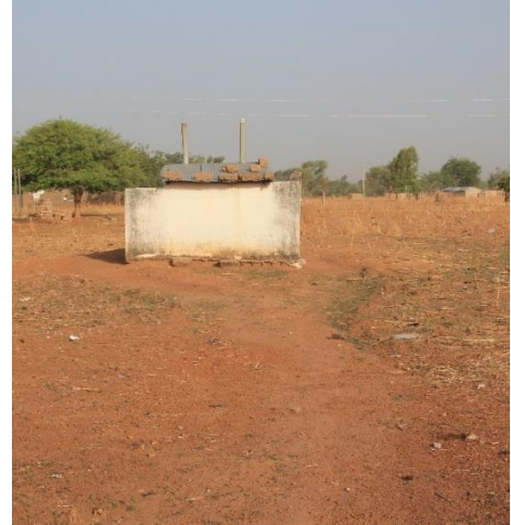
Verskillende latrines in Tongo, op de rechterfoto is de latrine van Abdallah's coumpound zichtbaar.