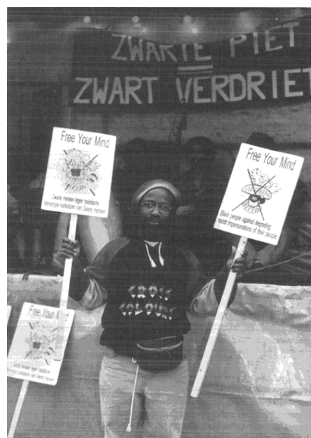
Figuur 3 De publieke weerstand tegen Zwarte Piet groeit in de jaren 80 en 90 onder Surinaamse jongeren, zoals blijkt uit dit protest van het actiecomité ‘Zwarte Piet = Zwart verdriet’ in Amsterdam in 1998.

Net als het Sinterklaasfeest zelf, wordt de discussie rondom Zwarte Piet een jaarlijks terugkerende traditie. De maatschappelijke discussie wordt vanaf de jaren tachtig tot heden in golfbewegingen voortgezet. Er worden op kleine schaal alternatieven voorgesteld of uitgevoerd, zoals gekleurde pieten of een donkere Sinterklaas (Kozijn 2014: 18-19).