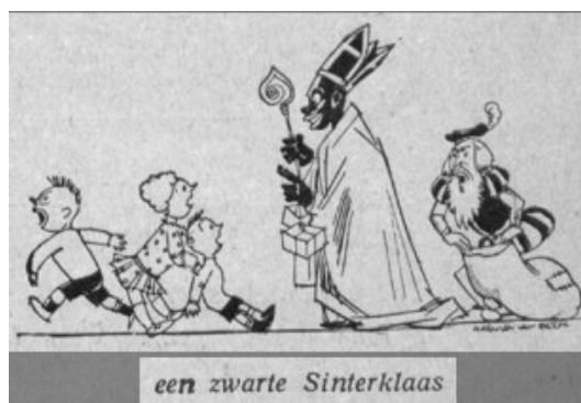
Figuur 2 Illustratie bij Stoke's artikel in De Groene Amsterdammer, 19 april 1930

Hoewel de kleur van Zwarte Piet een van de meest besproken onderwerpen is van 2013, is de discussie niet nieuw. In 1930 schreef Melis Stoke (pseudoniem) in het zogenoemde 'negernummer' van De Groene Amsterdammer een aanklacht tegen de stereotyperende weergave van mensen met een donkere huidskleur. Zo stelde hij voor om deze stereotypering te doorbreken door bijvoorbeeld de aanstaande sinterklaasviering met een zwarte Sinterklaas te vieren, zoals de illustratie in figuur 2 weergeeft.