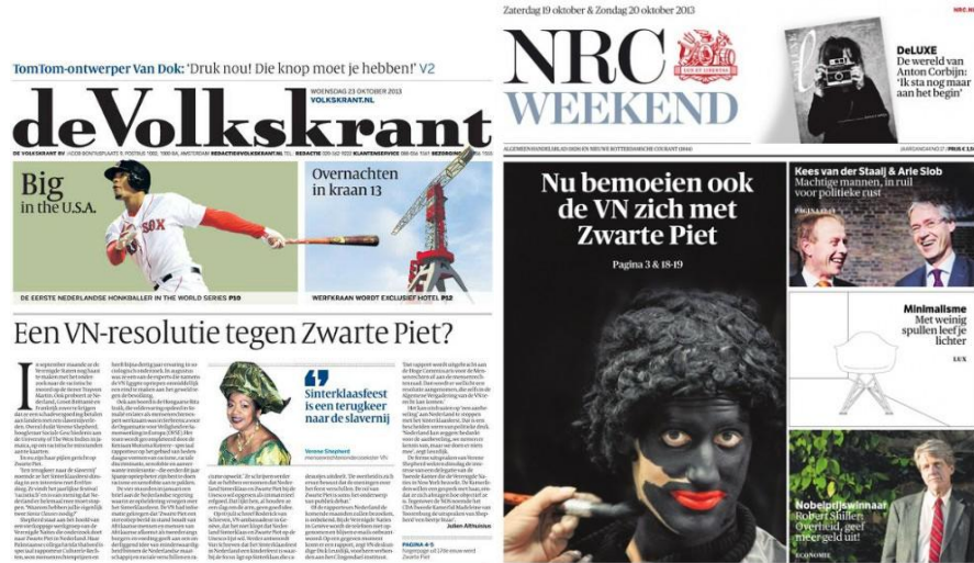
Figuur 4 Na de uitspraak van Verene Sheperd is de aandacht van de VN voor Zwarte Piet voorpagina's, oktober 2013.

In de dagen en weken die volgen na het interview met Sheperd bij EenVandaag, besteden kranten, opiniebladen en praatprogramma's aandacht aan de kwestie. Als kritiek op de bemoeienis van de VN en voor het behoud van een zwarte Zwarte Piet, wordt de Facebookpagina 'Pietitie' opgericht, die binnen enkele dagen meer dan 2,1 miljoen keer wordt geliked. Tegenstanders van Zwarte Piet verzamelen zich op de Facebookpagina 'Zwarte Piet is Racisme', die is opgericht in 2011.