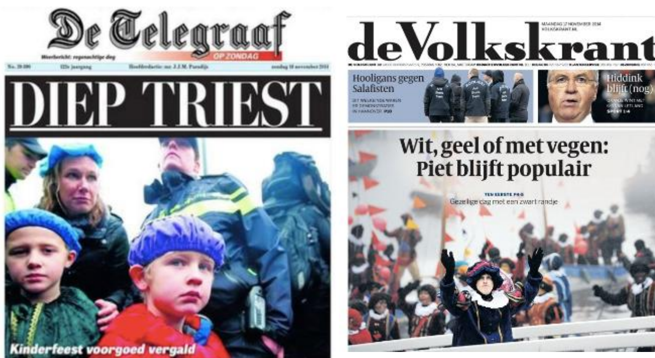
Figuur 1 Verschillende frames om dezelfde Sinterklaasintocht te beschrijven: de voorpagina's van De Telegraaf en de Volkskrant na de Sinterklaasintocht in november 2014.

Kwalitatief framingonderzoek naar frames in het publieke debat en publieke uitingen van gemeenten en bedrijven naar aanleiding van het debat over Zwarte Piet in 2013 en 2014