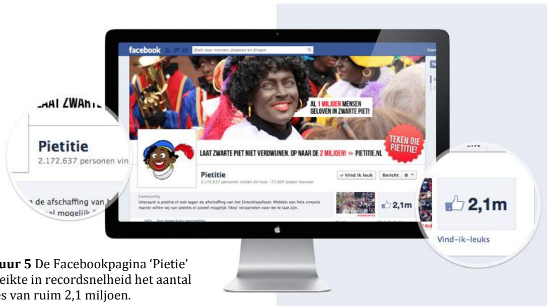
Figuur 5 De Facebookpagina 'Pietitie' bereikte in recordsnelheid het aantal likes van ruim 2,1 miljoen.

De pagina 'Zwarte Piet is Racisme' is in 2011 gestart met het doel mensen te informeren over de racistische elementen in het Sinterklaasfeest. De pagina behaalde 16.000 likes en 'streeft naar een Sinterklaasfeest dat saamhorigheid viert, zonder racistische bijmaak en zonder uitsluiting.' Initiatiefnemers van de pagina zijn Quinsy Gario en Kno'Ledge Cesare, maar de pagina wordt sinds enkele jaren onderhouden door Gario. Gario en Cesare kwamen eerder in het nieuws toen ze bij de Sinterklaasintocht in Dordrecht in 2011 door de politie werden opgepakt omdat ze een T-shirt droegen met de tekst 'Zwarte Piet is Racisme' (Kozijn 2014: 41, 108).