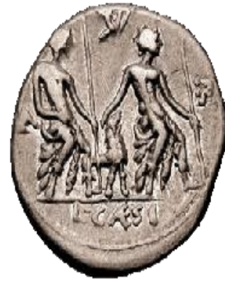
(Afb. 5 Caesiamunt)

Ovidius, Plutarchus en Varro hebben geschreven waarbij het ging om twee jeugdige figuren met hond. 248 De beelden zijn er niet meer waardoor het maken van een beeldvergelijk onmogelijk is. De zogenaamde Caesiamunten zijn er nog wel. Deze munten uit 104 v.C. dragen een beeltenis van twee jongeren in zittende pose, in hun hand dragen ze een speer en tussen hen in zit een hond. Rondom de inscriptie is een monogram van het woord LARE aangebracht. 249