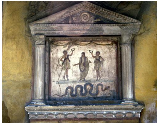
(Afb. 1 Lararium in het Huis van de Vettii . Pompeii, circa. 62 n.C.)

De aanbedding van de huisgoden behoorde tot de huiselijke en privésfeer. Elk Romeins huis, of het nu een villa of een simpele hut was, had op zijn minst één lararium. Een standaard voorbeeld betreft het lararium in het atrium van het Huis van de Vettii in Pompeii. Dit schrijn, een plek die heilig werd geacht en als focus diende voor het uitvoeren van een ritueel, bezit namelijk alle sleutelementen van de huiselijke aanbedding.