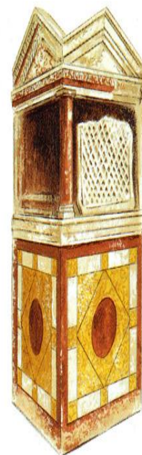
(Afb. 2. Lararium in het huis Menander)

Een aediculae is als het ware een miniatuurtempel omdat het zuilen, entablature en een pediment heeft. Deze elementen zijn vaak rond nisjes aangebracht, in beeldhouwde of geschilderde gestalte maar er zijn ook andere vormen. Aediculae stonden soms op een podium tegen de muur. Een hele mooie is bijvoorbeeld gevonden in het huis van Menander in Pompeii. Het betreft een drie dimensionale miniatuurtempel, opgenomen in een hoek van het atrium. Op afbeelding 2 is te zien dat het altaar wordt overdekt door twee pedimenten die steunen op het zuiltje van de voorste hoek. Bij dit schrijn is geen figuurlijke decoratie aangebracht. De meeste van deze aediculae zijn vrijstaand. Boyce telt er achtenveertig waarvan vier rondom een nis. Acht zijn er voorzien van een geschilderd beeldprogramma, en bij één is er sprake van een beeldhouwd reliëf. 206 Sommige aediculae hadden houten deurtjes zodat het schrijn afgesloten kon worden. Kortom, ze zijn er in vele soorten en maten, vaak gemaakt van stucco, terracotta of marmer. Vooral in Herculaneum zijn de houten exemplaren gevonden. 207