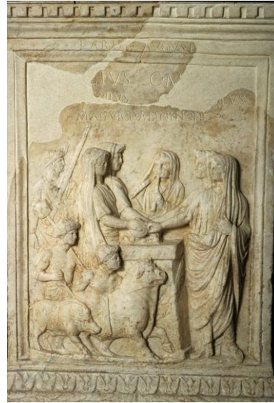
(Afbeelding 3 en 4, Compitum Vicus Aesculeti)

De magistri worden bijgestaan door de victimarius en de tibicen , de offerdienaar en de fluitspeler die bij de ceremonie van de huiscultus ook aanwezig waren. Eén van de magistri houdt een patera vast, de ander een staafje wierook. In de scene worden een varken en een stier geofferd wat niet vreemd is. In de huiselijke lararia staat regelmatig het varken als offerdier afgebeeld en uit de antieke teksten is ook naar voren gekomen dat varkens en zwijnen aan laren werden geofferd. De Stier is echt bedoeld als offerdier voor de keizer, in dit geval geofferd aan zijn genius . De dieren worden vastgehouden door figuren met een ontbloot bovenlijf, de victomarii , dat ze veel kleiner zijn uitgebeeld maakt duidelijk dat ze minder hoog in aanzien stonden dan de magistri . De linker victomarius draagt een mallet , een houten hamer, om het dier buitenwesten te slaan. De andere zit geknield achter het offerdier waardoor alleen zijn ontblote borst en zijn laurierkroon zichtbaar zijn. Er is een inscriptie die luidt: LARI[us] AUGUST[is], gevolgd door de namen van de vier magistri en een laatste regel die het jaartal aangeeft. Het altaar was opgericht sinds het negende jaar na aanstelling van de magistrii . 245