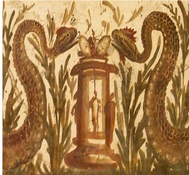
(Afb 6. Fragment van lararium met twee slangen )

Hier een fragment uit een lararium uit Pompeii van twee slangen die zich tussen de planten bij een altaar bevinden. Er is duidelijk te zien dat het gaat om een mannetjes- en vrouwtjesslang, de rechter heeft een kam en een baard, de linker alleen een kam. Op het altaar liggen twee eieren en in het altaar is de figuur van een genius te zien. Het fragment maakt onderdeel uit van een scene waarbij boven de slangen laren, een genius , een tibicen , een camillus en een vicimagi staan uitgebeeld.