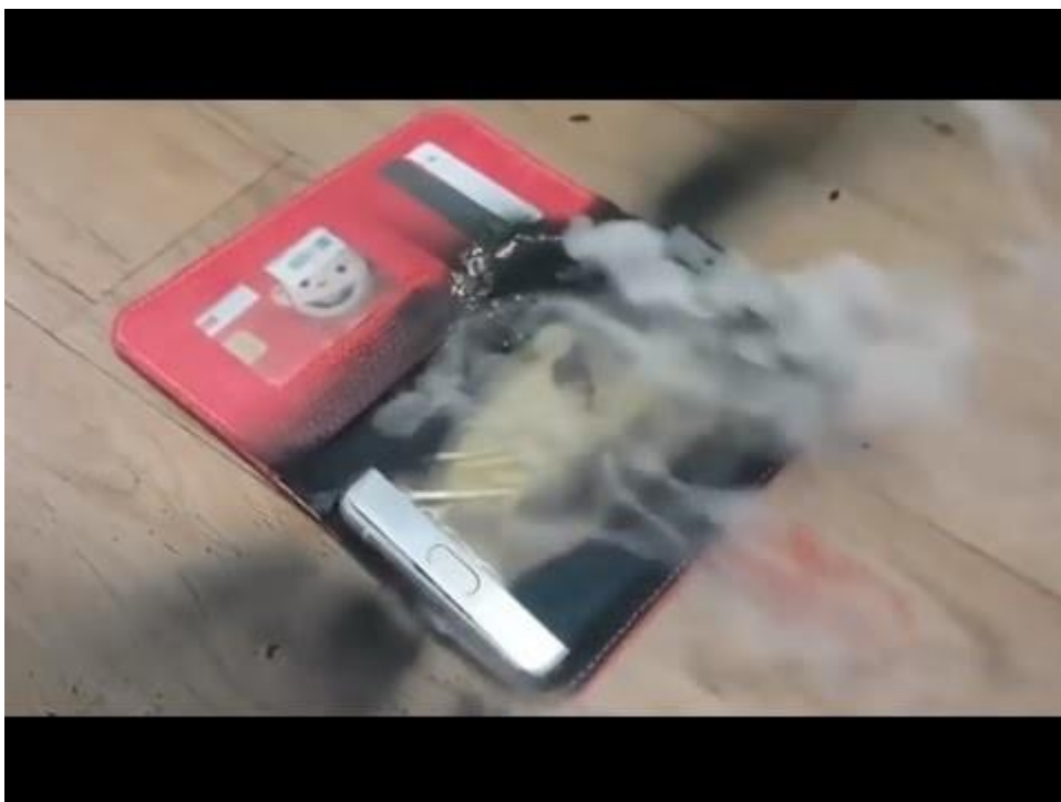
Compilatie van ontploffende Samsung Note 7-toestellen

Weet je nog, vorig jaar, de Samsung Note 7?