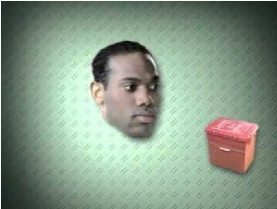
Reclamespotje van de Rijksoverheid uit 1996

Een snelle terugblik op wat ons beeld van de batterij heeft gevormd. Wie boven de dertig is (jij denk ik net, mijn beste caissière), herinnert zich wellicht dit tv-spotje van de Rijksoverheid: