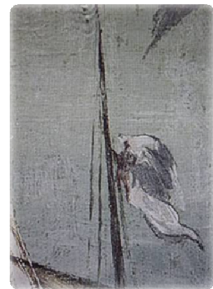
Afb. 16. Onderdeel van afbeelding 2.