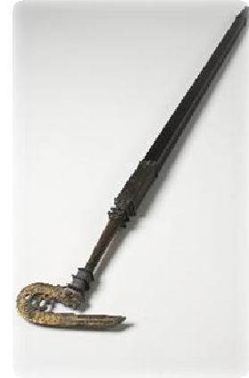
Afb. 10. Anoniem, ‘Wandelstaf van Cornelis Dirksz.’, 1573, Maritiem Museum.