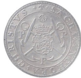
Afb. 7. Caspar Wijntgens, 'Penning van admiraliteit Hoorn' achterzijde, 1615, Scheepvaart Museum Amsterdam.

Ook de admiraliteit van West-Friesland en het Noorderkwartier liet een gedenkpenning slaan, deze admiraliteit was sinds 1586 gevestigd in Hoorn. 92 Het is waarschijnlijk dat de admiraliteit zich in Hoorn vestigde vanwege de twee andere regionale functies van Hoorn: de Gecommitteerde Raden van West-Friesland en het Noorderkwartier waren in de stad gevestigd, ook had de stad het recht om de West-Friese munt te slaan. 93 Tevens was Hoorn een regionaal handelscentrum. Sinds de 16 e