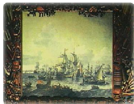
Afb. 8. Jan Theunisz. Blanckerhoff, Slag op de Zuiderzee , 1663, Rijksmuseum Amsterdam.

In 1663 schilderde Jan Theunisz. Blanckerhoff dit schilderij in opdracht van het College van Gecommitteerde Raden van West-Friesland en het Noorderkwartier, 103 de lijst werd gemaakt door Joh. Kinnema in 1668. 104 In de zomer van 1573 werd de eerste vergadering van de Gecommitteerde Raden van West-Friesland en het Noorderkwartier in Hoorn gehouden. De stad was uitgekozen vanwege