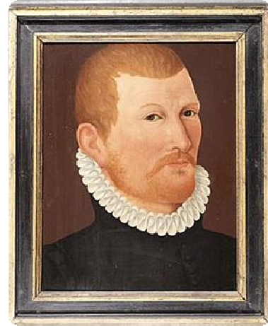
Afb. 15. Anoniem, 'Portret van Jan Floor', laatste kwart zestiende eeuw, Westfries Museum.

Er is een portret van Jan Floor bewaard gebleven, dat wordt gedateerd op 1599. 92 Het museum heeft deze datering gebaseerd op de stijl van het schilderij en de datering van de slag. Het is hoogstwaarschijnlijk dat het al vóór 1617 bestond. 93 Op het portret is een man afgebeeld van tussen de dertig en de veertig jaar: hij heeft nog geen rimpels. In 1599, zesentwintig jaar na de slag, had Jan deze leeftijd al gepasseerd, wellicht was hij destijds al overleden. Het portret betreft dus geen eigentijdse afbeelding van de held. Wie het portret heeft geschilderd is onbekend. Het schilderij is aan het Westfries Museum in