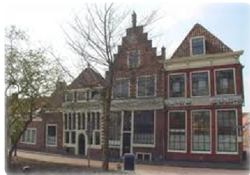
Afb. 3. Anoniem, 'Bossuizen', Slapersdijk in Hoorn.

Rond 1612 werden drie aangrenzende huizen aan de Slapershaven 1 en 2 en Grote Oost 132 52 versierd met indrukwekkende gevelbrede reliëfs. Aan de voorkant van het huis aan de Grote Oost 132 is de gevel ook versierd. Eén versiering is een wapen met daarin het jaartal 1612, een andere versiering is het wapen van prins Maurits.