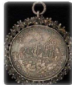
Afb. 5. Caspar Wijntgens, 'Penning van Hoorn' voorzijde, 1615, Scheepvaart Museum Amsterdam.

Rond dezelfde tijd liet Hoorn een gedenkpenning slaan. Op de penning staat een jaartal genoteerd. Er zijn verschillende versies van de penning bekend, namelijk met de jaartallen 1613 81 , 1615 82 en 1620 83 , op de jaartallen na zijn de penningen zo goed als identiek. In de literatuur over Hoorn wordt steevast de datering van 1620 aangehouden. Soms wordt vermeld dat de penning is geslagen ter herdenking van het ophangen van het bord met jaardicht van Cornelis Taemsz. in 1615. 84 Op de voorzijde is een afbeelding van de slag te zien, op de achtergrond is het stadsgezicht van Hoorn afgebeeld. Om de afbeelding heen staat de tekst: 'Inquisitio