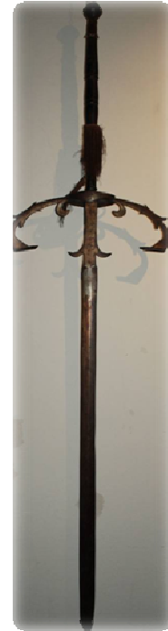
Afb. 12. Anoniem, 'Slagzwaard van Bossu', 1550-1569, Westfries Museum.