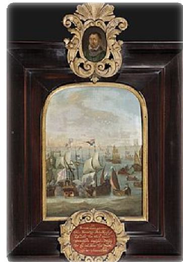
Afb. 2. Anoniem, Slag op de Zuiderzee , eerste kwart zestiende eeuw, Westfries Museum.

De vlag van het admiraalsschip de Inquisitie was in het koor van de Grote Kerk opgehangen, het is in 1727 zoek geraakt toen het koor werd vernieuwd. 26 Aangezien er in het medaillon staat dat er een stuk van de vlag aan het schilderijtje was bevestigd, is in 1727 een deeltje van de resten van de vlag aan dit schilderijtje gehangen. Het medaillon met de tekst zal ter ere van de toevoeging van het stukje vlag aan het schilderij zijn gemaakt. Het medaillon met het portret is waarschijnlijk in deze tijd bevestigd, het komt in ieder geval niet uit de zestiende eeuw want de stijl van de cartouche is daarvoor te modern. 27 Het portret lijkt op een prent van Bossu uit 1578 en een gravure uit de 17 e eeuw. 28