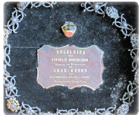
Afb. 9. Anoniem, 'Keten van Bossu' en 'Ring van Cornelis Dirksz.', Waterlandsmuseum de Speeltoren.

Er zijn verschillende relieken bewaard gebleven die aan Cornelis Dirksz. zouden hebben toebehoord, de bekendste is een deel van de keten van het Gulden Vlies. 62 De familie heeft de keten vast zelf een tijd in haar bezit gehouden. De keten is ergens tussen 1573 en 1767 door de familie aan het stadhuis geschonken: in de tweede druk van Meyers beschrijving van Monnickendam uit 1767 63 staat namelijk dat de keten op het stadhuis van Monnickendam te zien is. 64 Waarschijnlijk was het keten ook al in aanwezig op het stadhuis ten tijde van de eerste druk, die na 1651 zal hebben plaatsgevonden. 65 In latere bronnen wordt gemeld dat maar een deel van de keten bewaard wordt, in Meyers vermelding komt dit echter niet ter sprake. 66 Het is onwaarschijnlijk dat de keten tijdens haar verblijf in het stadhuis is opgedeeld: het object werd op deze locatie veilig bewaard. Vermoedelijk is de keten verdeeld onder de mannelijke nakomelingen van de admiraal: Leendert Appel schrijft dat Cornelis vijf dochters had en drie zonen. 67 Appel acht het echter plausibeler dat de overige