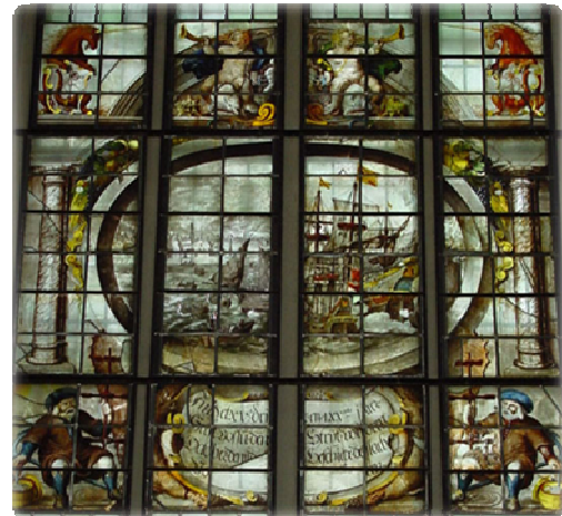
Afb. 4. Anoniem, 'Het glas van Hoorn', 1619, Oosterkerk in Hoorn.

Al spoedig bleek dat er in Hoorn weinig aanhang was voor de contraremonstrantse godsdienst: remonstranten bleven in grote getale hun bijeenkomsten houden, de prins gaf daarom opdracht tot strenge maatregelen. 75 Dit stuitte echter op verzet, van onder andere predikant Sapma, die een beslissing van het stadsbestuur en de voorzitter van de Nationale Synode in de wind sloeg. Dit resulteerde in rellen in de stad op 10 maart 1619. Bovendien bleven remonstranten in 1619 en 1620 gewoon bijeenkomsten houden in hun huizen. 76 Na 1619 namen hun aantallen af, ook namen de spanningen af doordat er minder streng in Hoorn werd opgetreden tegen remonstranten dan in andere plaatsen. 77 De onlusten tussen remonstranten en contraremonstranten in 1618 en 1619 leidde tot spanningen tussen de inwoners van Hoorn. Er was zodoende een groot belang om te proberen de bewoners te verenigen op grond van niet-religieuze redenen. De slag uit 1573 stond symbool voor eensgezindheid en eendracht van het toenmalige zo krachtige en succesrijke Hoorn. Het is