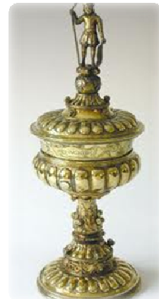
Afb. 1. Anoniem, 'Beker van Bossu', 1530-1540, Westfries Museum.

Het is niet bekend waar de beker op het stadhuis werd bewaard. De bestuurlijke elite kon de beker bewonderen op het stadhuis. De beker zal bij rondleidingen aan publiek ten toon zijn gesteld. 22 Ook zal de beker bij speciale gelegenheden buiten zijn tentoongesteld. 23