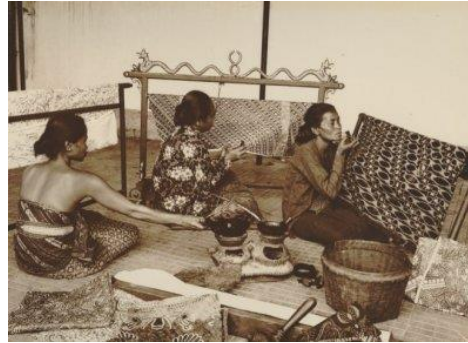
Afbeelding 9 Javaanse vrouwen aan het batikken, vermoedelijk in Soerabaja circa. 1925

In digitale databases vond ik weinig foto's van mannen die werkzaam waren in batikbedrijven. Op een foto gemaakt op west-Java, is te zien hoe mannen bezig zijn met het kleuren van batikdoeken. Zij dragen een donkergekleurd shirt met korte mouwen en een broek. Op een foto waarop te zien is dat doeken worden voorzien van stempels, staan mannen die een overhemd dragen, waarop ook borstzakken zijn genaaid. 235 De kleding kan een vrije keuze zijn geweest of te maken hebben met een bepaalde functie.