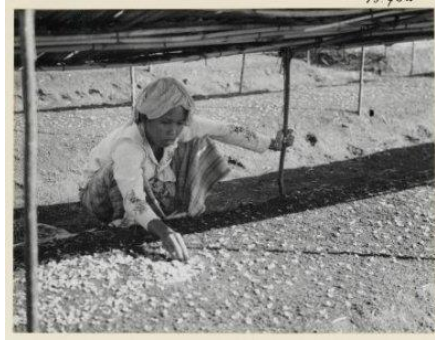
Afbeelding 15: Vrouw is bezig met het uitdunnen van tabaksbibit op tabaks- en rubberonderneming Tandjong-Morawa bij Loeboekpakam