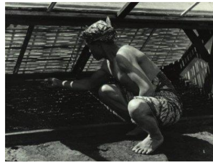
Afbeelding 19: Het planten van kinazaden in kweekbedden, vermoedelijk op het Gouvernement kinaplantage Tjinjiroean, circa. 1930.