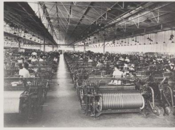
Afbeelding 7: Weefzaal in de Preanger Bontweverij te Garoet.

Foto's van kleinere weverijen en spinnerijen op Java, waarop alleen vrouwen zijn afgebeeld, laten ook zien dat vrouwen waren gekleed in een sarong en een, meestal lichtkleurige of witte, kabaja . 233 Afbeeldingen van batiksters in het kraton van Jogjakarta en een batikfabriekje in Soerabaja wijzen uit dat er ook andere donkergekleurde kabaja's werden gedragen. Daarnaast zijn er werkneemsters van batikbedrijven te zien die een kemben (borstdoek) of singlet (hemd zonder mouwen) dragen. Op basis van het beschikbare fotomateriaal kan worden gesteld dat er bij de keuze van het dragen van een kabaja een verschil bestond tussen vrouwelijke werkneemsters van textielweverijen en batikbedrijven rond de jaren '30. In textielweverijen zijn de kabaja's vrijwel allemaal licht (wit) van kleur, terwijl er naast wit ook zwart en verschillende grijstinten zijn te zien (kleurdiversiteit) bij de bovenkleding van werkneemsters in lokale batikbedrijven. Daarnaast wijzen foto's van begin twintigste eeuw erop dat batiksters zowel een kemben als kabaja droegen. Op basis van de door mij onderzochte foto's kan daarom worden gesteld dat er in de jaren '30 een verschuiving plaatsvond waarbij steeds vaker een kabaja werd gedragen in plaats van een kemben . 234