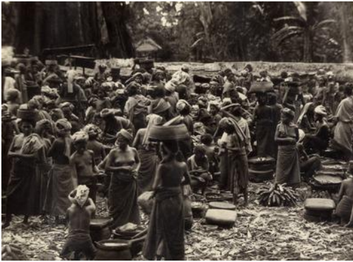
Afbeelding 20: Markt in een dorp op Bali omstreeks 1933.