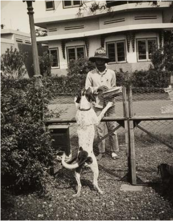
Afbeelding 24: Postbode in Batavia, 1936

Staatsbedrijf der Posterijen, Telegrafie en Telefonie (P.T.T.) dat werd gebruikt tussen 1935 en 1950. 266