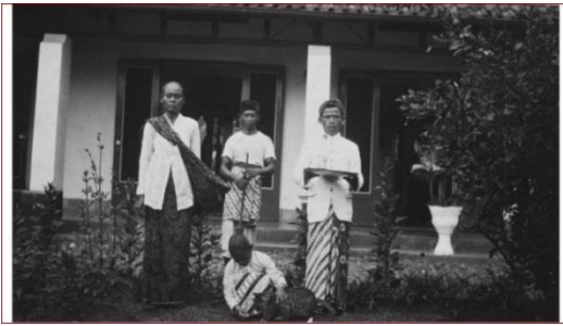
Afbeelding 22: Het huispersoneel op Java (datering: 1929-1939)

mannelijke personeel grotendeels was gekleed in een lichtgekleurde djas toetoe (traditioneel jasje) in combinatie met een sarong , waarbij het garis miring (schuin lopende lijnen) patroon het meeste voorkomt. Op het hoofd dragen zij traditionele hoofddeksels. Ook kwam het voor dat de djas toetoe werd gedragen in combinatie met een broek. Verder wijzen foto's uit dat sommige mannelijke bedienden ook een lichtgekleurd overhemd droegen, soms met een colbertjasje, in combinatie met een lichtkleurige broek. 263