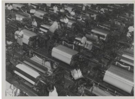
Afbeelding 3: De weverij van de Java Textiel Maatschappij in Tegal