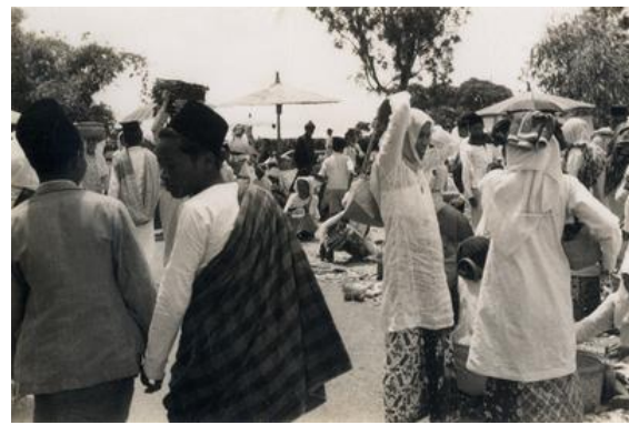
Afbeelding 21: De Markt van Fort de Kock (Sumatra), 3-5-1939