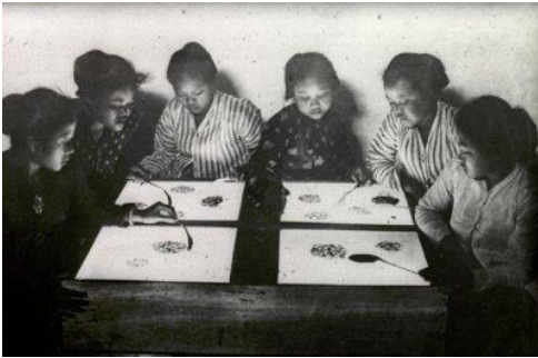
Afbeelding 18: Het sorteren van kinazaden in Nederlands-Indië, omstreeks 1935.

stippen, bloemen en stervormen. 251 Mogelijk zijn dit ook nieuwe dessins die werden gemeld door de Werkcommissie van de herziening van de contingentering van diverse manufacturen. Kleding, gedragen door de inheemse bevolking die betrokken was bij het oogsten van kapok, laat een vergelijkbaar beeld zien met de kleding die werd gedragen op tabak- en kinaplantages.