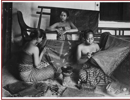
Afbeelding 8: Een geposeerde opname van een batikwerkplaats op Java circa. 1915