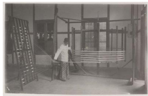
Afbeelding 5: Handscheermolen in de Textiel-Inrichting te Bandoeng, 1934