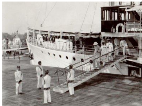
Afbeelding 12: Gouverneur-Generaal B.C. de Jonge gaat van boord in de haven van Soerabaja

Op enkele foto's is te zien dat medewerkers met een ontvangstaak traditionele hoofddeksels dragen. Dit is onder meer te zien op een foto waarbij een autochtone werknemer staat naast de loopplank van het m.s. Van der Wijck van de KPM. Tijdens de aankomst van de Gouverneur Generaal B.C. de Jonge, in de haven van Soerabaja, staan aan weerszijde van de loopbrug vier autochtone mannen die gekleed zijn in een witte broek en djas toetoe (traditioneel jasje), zoals te zien is op onderstaande foto (afbeelding 12). Op het hoofd dragen zij een traditioneel doek, een blangk . Onder het middel is te zien dat zij een traditionele, vermoedelijk gebatikte, doek hebben omgeknoopt.