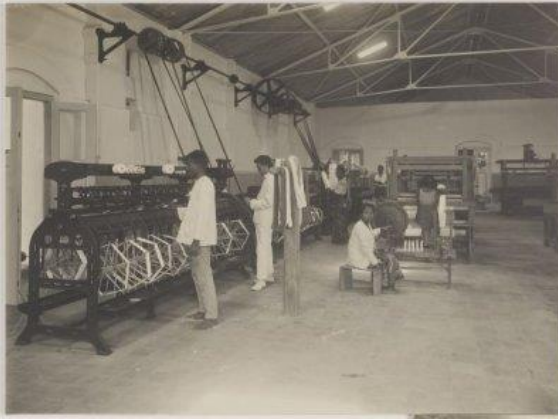
Afbeelding 6: Kruis- en handspoelmachines in de Textiel-Inrichting te Bandoeng circa. 1930.