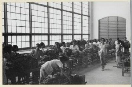
Afbeelding 13: Vrouwen controleren de gesorteerde tabak op tabaks- en rubberonderneming Tandjong Morawa bij Loeboekpakam, omstreeks 1938.