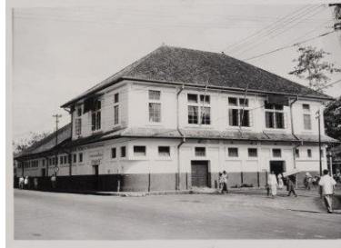
Afbeelding 2: Kantoor Jacobson van den Berg & Co. te Palembang