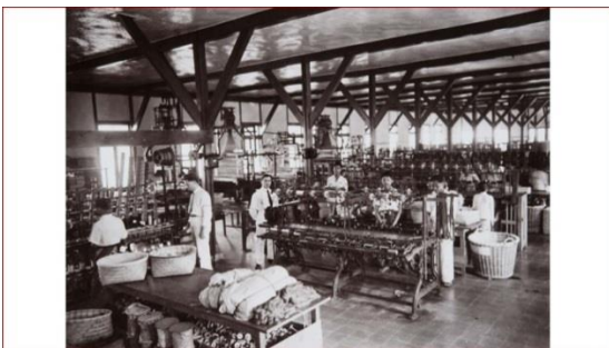
Afbeelding 4: Mechanische weverij in de Textiel-Inrichting Bandoeng, (datering 1920-1932)

Door het beperkte beschikbare beeldmateriaal, meestal zonder begeleidende tekst, valt het helaas niet te zeggen of de verschillen in 'moderne' en 'traditionele' mannenkleding ook kan worden gerelateerd aan de functie van werknemers binnen het bedrijf. Wel kan worden geconstateerd dat in de Textiel-Inrichting zowel autochtone mannen als vrouwen zich meestal traditioneel kleedden. Ik heb niet kunnen vinden of er in de fabrieken verplichte kledingvoorschriften van toepassing waren en of er kledingvoorschriften golden voor bepaalde werkzaamheden, bijvoorbeeld ter bescherming bij chemische processen.