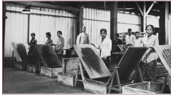
Afbeelding 17: Theefabriek op de plantage Dajeuh-Mangoeng bij Garoet (datering 1930-1940)

Andere plantages, waar zowel mannen als vrouwen op het land werkten, waren kinaplantages. Van kinabomen wordt de schors gebruikt voor het maken van kinine, dat tot op heden de basis is voor medicijnen tegen malaria. 249 De meeste door mij geanalyseerde foto's zijn gemaakt op een plantage van het gouvernement in Tjinjioean, nabij Bandoeng. Wat mij opviel is dat alle mannen op de plantage een traditionele hoofddracht ( blangkon ) hebben. Afwisselend dragen mannen die oogsten een broek of een omgeslagen doek. Er zijn zowel bont geweven als batikpatronen te herkennen. Inheemse mannen met een hogere functie dragen een lichte witte djas toetoe p in combinatie met een lange witte broek en blangkon op het hoofd. 250 Door de verschillen in kleding is een duidelijk onderscheid te maken in de sociale positie van werknemers. Bij de kleding van koelies op kinaplantages valt op dat de kleding, net als bij koelies op de tabaksplantages, niet overeenstemt met de 'koeliedracht' zoals die door de Werkcommissie voor herziening van contingenten van diverse manufacturen werd beschreven.