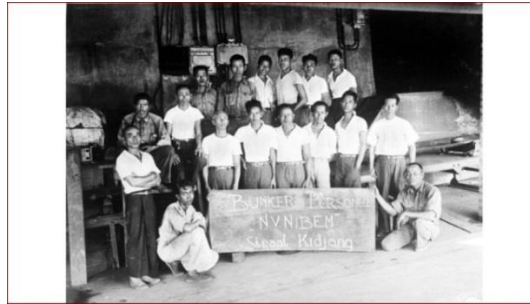
Afbeelding 11: Het personeel van de N.V. NIBEM, 1936.

de KPM is er waarschijnlijk sprake van voorgeschreven dienstkleeding. De kleding straalt eenheid uit en draagt bij aan een zichtbare identiteit.