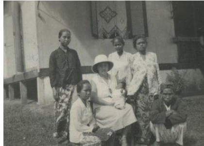
Afbeelding 23: Europese vrouw en bedienden voor Semarang de woning in Nederlands-Indië, circa. 1930