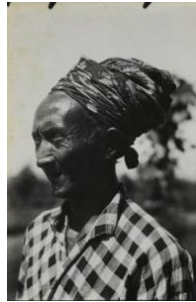
Afbeelding 1: Oude Balinese man met een bont geweven katoenen shirt, omstreeks 1920.

gemaakt zoals shirts. In het bijzonder worden ook 'pyjama's' genoemd in een notulen van de Werkcommissie voor herziening van de indeling van de contingentering van diverse manufacturen. 82 De vrouwen uit de armste laag van de bevolking droegen kleding, vervaardigd uit geverfde en gedrukte katoenen stoffen zoals shirts, kabaja's en sarongs , die niet breder waren dan 24 inch. 83