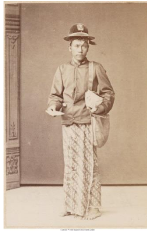
Afbeelding 25: Portret van een postbode eind 19 e

of begin 20 ste eeuw. Bron: SDCF via KB #MM. 489/096