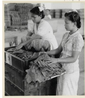
Afbeelding 14: Vrouwen pakken tabak af en stapelen de tabak in perskisten tabaks- en rubberonderneming Tandjong Morawa bij Loeboekpakam, omstreeks 1938.

Verder valt op dat er geen decoratieve borduursels zijn aangebracht op de kabaja's van werkneemsters op de sorteerafdeling van de tabaksplantage. In dit opzicht is één afbeelding van een vrouw (zie afbeelding 15), die bezig is met het uitdunnen van tabaksbibit (tabak kweekplantjes) op het land, bijzonder. Op de lichtkleurige kabaja zijn aan onderkant van de (lange) mouwen en kraag bloemmotieven genaaid. 243 Uit een welvaartsenquête van de Deli Plantersvereniging bleek dat één op de twintig vrouwelijke werknemers een naaimachine bezat. 244 Waarschijnlijk had deze vrouw een naaimachine en gaf een persoonlijk tintje aan haar kleding. Vergelijkbare versieringen zijn niet te zien op kabaja's van andere vrouwen die op het land werkten. Het feit dat ik één foto vond van een vrouwelijke werkneemster die een kabaja droeg met opgenaaide bloemmotieven roept de vraag op of er vaker versieringen werden aangebracht op kabaja's en in hoeverre deze decoraties een symbolische of esthetische functie hadden.