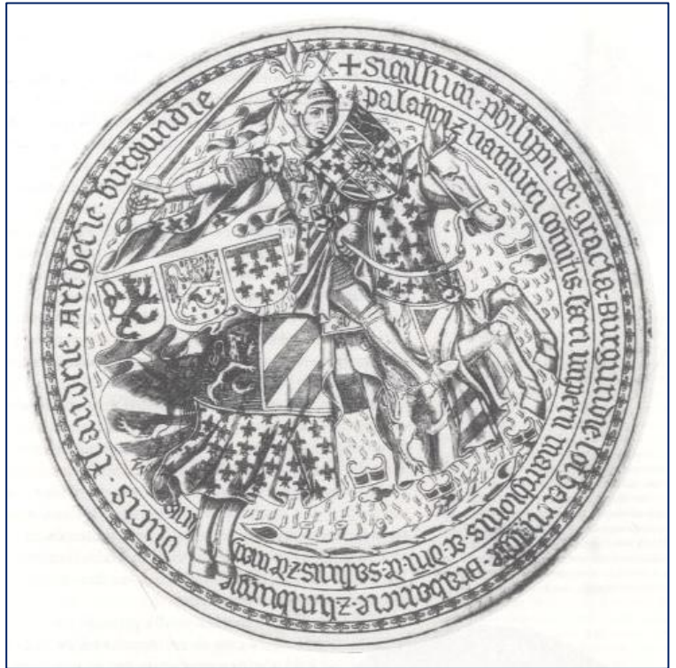
Figuur 5 Wapenschild van Philips de Goede met in het tweede kwartier het wapen van Brabant, ca 1430. In: De Vries, Wapens van de Nederlanden , 25.

Wat symboliek betreft werd Philips de Goede bij zijn Blijde Inkomst in Leuven op 5 oktober 1430 verplicht de titels en wapens van Brabant, Limburg, Lotharingen en het markgraafschap Antwerpen in zijn titulatuur te verwerken en aan te brengen op de officiële zegels. 149 Philips sputterde niet tegen en schikte zich in de wil van de Staten van Brabant. Voor het markgraafschap Antwerpen en het overkoepelende Lotharingen werden echter pas later de wapens ontworpen, respectievelijk in 1465 en 1439. 150 Om te voldoen aan de eisen van de Staten werd daarom de Brabantse gouden leeuw met rode tong en nagels op een zwart schild, als overkoepelend wapen gebruikt. De leeuw werd geplaatst in het tweede kwartier van het officiële Bourgondische wapen. Het wapen van Limburg, de rode leeuw met kroontje en gespleten staart, werd in het derde kwartier geplaatst. Het hertogdom Brabant nam dus een prominente plaats in, in het uiterlijk vertoon van de Bourgondische hertogen.