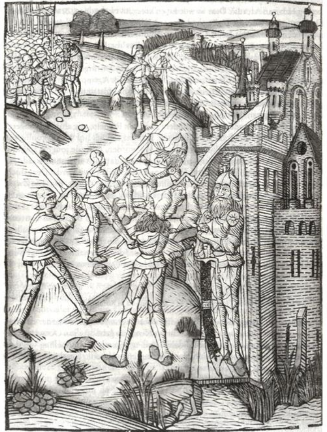
Figuur 3: Gevecht tussen Brabon en de reus in 3 fasen verbeeld, miniatuur uit Die alderexcellenste cronike van Brabant, 1479.

Heelu heeft het in de Rijmkroniek nergens expliciet over een Brabants territorium. Zijn werk begint niet met een opsomming van de territoriale rechten of een ontstaanslegende waar men trots op is. Gaat Heelu hier uit van een afdoende voorkennis van de eigen afkomst? Dat is toch merkwaardig, aangezien hij de kroniek opdraagt aan de Franstalige Margaretha. Als de kroniek aan haar opgedragen is, om haar kennis te laten nemen van het Middelnederlands en verhaalt van de grootste daden van haar schoonvader, waarom dan geen synopsis van de roemrijke Brabantse geschiedenis?