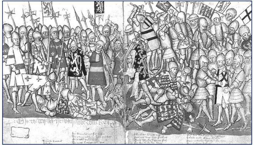
Figuur 4 De Slag bij Woeringen verbeeld in de Brabantse Yeesten , ca 1440. Koninklijke Bibliotheek België, Brussel, IV 685 folio 113v-114r.

Om dien hertoge, haren heere, Verwonderde hen allen seere; Want riddere, ende seriante Ghelieten alle als gygante, Die liever sterven wouden, Dan si in vremden lande souden Hare heere in noode laten. 107