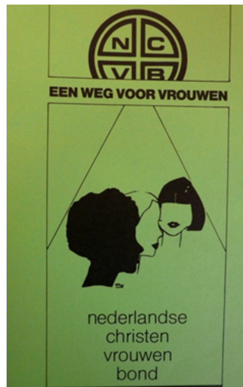
Affiche van de NCVB uit de jaren zestig. ATRIA archief NCVB, Inv. nr. D 111, 28.

slechts gedeeltelijk voor de NCVB. De religieuze en educatieve doelstelling bleef in alle jaren een belangrijk onderdeel uitmaken van de bijeenkomsten en dagtochten. Bij toenaderingspogingen van de Christelijke Plattelandsvrouwen plaatste de NCVB zich bijna als vanzelf weer op het standpunt dat in de bond geen plaats was voor eenvoudige huishoudelijke vorming, of die nu wel of niet geïntegreerd in het jaarprogramma was opgenomen. Of dat voor alle aangesloten leden gold mag worden betwijfeld, gezien het relatief lage opleidingsniveau van de meerderheid. Het alternatief volgens Vega, zou een vrouwenorganisatie zijn die zich identiek aan de staat (overheid) waande, wat in het geval van de NCVB ook niet kan worden bevestigd. De beginselvastheid van de NCVB en de voortdurende drang om haar confessionele stem in de samenleving te laten horen, maakte de bond tot een niet te miskennen onderdeel van die samenleving. De protestants-christelijke leden voelden zich opgenomen in een grote invloedrijke bond, die dan toch in ieder geval sterke