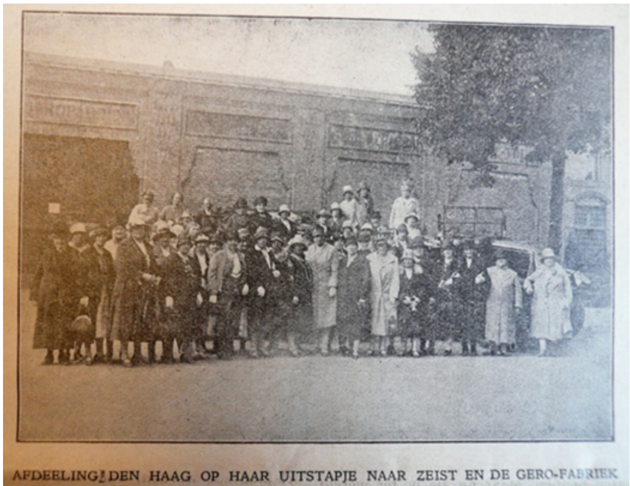
Afbeelding in De Christenvrouw , december 1929, 13.

De crisisperiode van de jaren dertig maakte dat oude waarden en normen ten aanzien van de rol van man en vrouw in alle protestants-christelijke literatuur de boventoon gingen voeren. Het streven van de vrouw naar een plek op de arbeidsmarkt maakte plaats voor een terugtrekken op eigen erf. Het weinige werk moest worden verdeeld, en wel onder de mannelijke kostwinners. Dit gegeven maakte dat veel van de aanvankelijk verworven plekken allengs door mannen werden ingenomen. Was de christelijke vrouwenbeweging weer terug bij af?