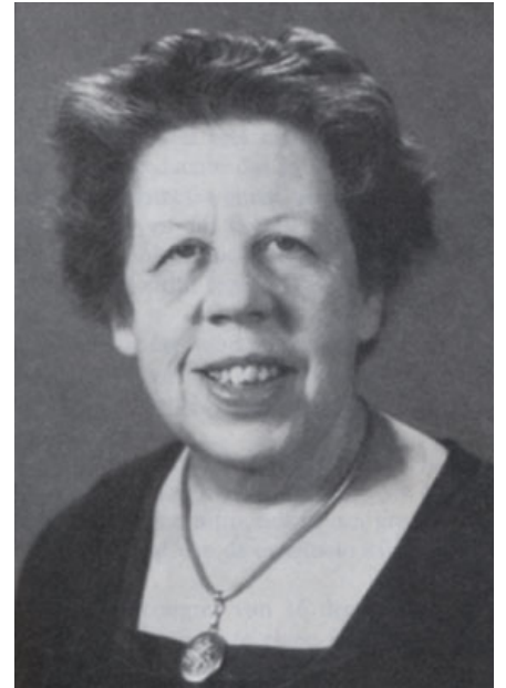
freule C.W.I. Wittewaall van Stoetwegen (1901-1986)

Het lijkt duidelijk dat ‘staatkundige voorlichting’ voor de vrouwen van de NCVB bepaald niet betekende dat er politiek stelling werd genomen, anders dan het bevestigen van de wijze waarop