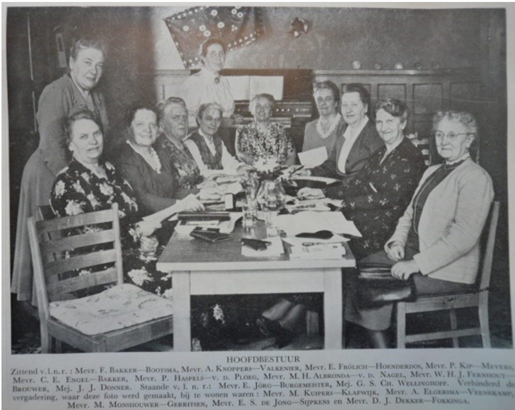
Hoofdbestuur van de NCVB 1949, in: A.C. Diepenhorst en C.F. Mackay, Na 30 jaren , 33.

In 1945 richtte de bondpresident voor de eerste keer na de oorlog in het eigen orgaan een oproep tot de leden van de NCVB om de schouders eronder te zetten en klaar te staan om nieuwe uitdagingen het hoofd te bieden. Waaruit bestonden die uitdagingen van die eerste jaren? “Beroepskeuze voor jonge meisjes, de materie van de vrouwen-hulpcorpsen, onze roeping jegens Indië,” 143 waren vlak na de oorlog de onderwerpen die op de afdelingen besproken werden en waarover begeleidend voorlichtingsmateriaal te verkrijgen was. Maar de president vroeg zich toch af: “Heeft de clausule van onze doelstelling betreffende de staatkundige voorlichting nog die waarde voor ons, waarop zij geschat moet worden?” 144 Er waren tal van onderwerpen waarvan de vrouw zich volgens Knoppers, op de hoogte behoorde te stellen, om te weten wat de toepassing van de christelijke beginselen op dit levensterrein was. 145 “Doet de leiding in al de geledingen van de bond wel haar uiterste best om bij te blijven in den chaos van voorgedragen theorieën en principes, om zodoende de politieke meening van ons vrouwen te beïnvloeden, vooral in die dingen die in het bijzonder het vrouwenleven raken?”, schreef ze in De Christenvrouw van juni 1945.