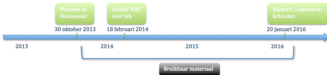
Figuur 8. Tijdslijn bruikbaar materiaal

hier met name rond 28 januari over, omdat op die datum Carola Schouten vragen over het onderzoek beantwoordt. Hierna blijft nieuwe berichtgeving over het lekschandaal vooralsnog uit. Daarom vormt dit moment het eindpunt van de selectie van materiaal (Figuur 8). In Bijlage 1 van dit onderzoek is de gehele lijst met bruikbaar materiaal per medium opgenomen. De lijst is als volgt tot stand gekomen. Per medium zijn maximaal vijf stukken toegevoegd die het meest bruikbaar zijn. Een stuk is beter bruikbaar naarmate er meer uitspraken in staan van politici met betrekking tot de Stiekemgate. Veel mediaorganisaties nemen uitspraken van elkaar over. Op het moment dat extra materiaal inhoudelijk nauwelijks meer verschilt van het materiaal dat al opgenomen is, is er sprake van verzadiging en wordt geen extra materiaal verzameld. In de volgende alinea's wordt uitgelegd hoe de selectie van het materiaal per medium tot stand komt.