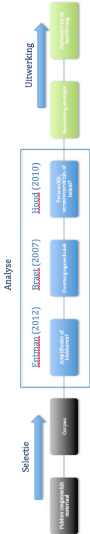
Figuur 5. Analysemodel