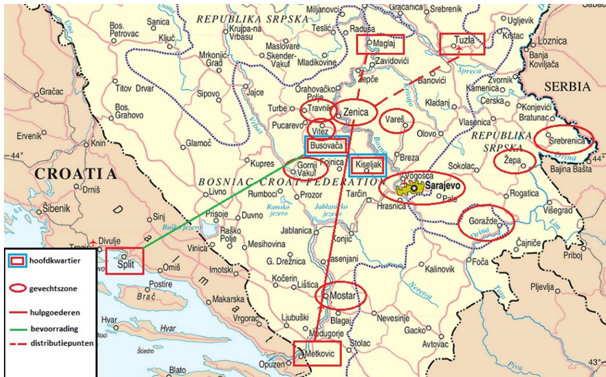
afbeelding 2 - Transportroutes en gevechtszones Centraal-Bosnië (markeringen zijn geen precieze weergave van transportroutes en frontlinies)

Verder naar het zuiden werd de botsing tussen de HVO en ABiH ook gevoeld. In Mostar leefden de Bosnische-Kroaten en Moslims na het vertrek van de Serven in de zomer van 1992 gescheiden van elkaar in een westelijk en oostelijk deel van de stad. Mostar was overwegend Kroatisch, maar in mei 1993 verschoof deze balans, toen tussen de 16.000 en 20.000 Moslimvluchtelingen hun toevlucht namen in de grootste stad van Zuid-Bosnië. De Bosnisch-Kroatische bevolking zag dit als een daad van demografische agressie en beantwoordde deze door in de vroege uren van 9 mei het oostelijke deel van Mostar onder vuur nemen met artillerie, mortieren en kleine en zware wapens. De HVO nam bezit van alle toegangswegen tot Mostar en ontzegde internationale organisaties toegang tot de stad. Het kwam tot straatgevechten tussen de HVO en het ABiH, slechts gescheiden van elkaar door een boulevard die de stad in tweeën splitste. De gehele periode waarin de tweede lichter van het transportbataljon haar transporten reed, bleef Mostar omsingeld door HVO-troepen. Als gevolg van de omsingeling, diverse bombardementen en moordpartijen door HVO-soldaten, vonden duizenden Moslims in Mostar in die maanden de dood. 108