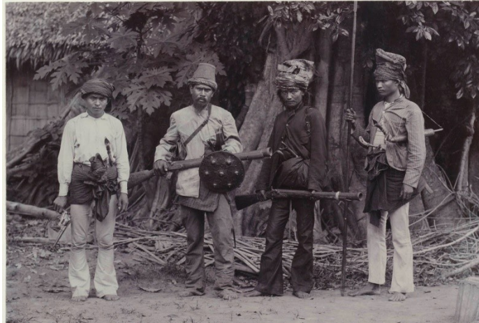
'Vier typen van Atjehsche kwaadwilligen (djahat)' ca. 1900.

De in oktober 1925 een betrekkelijk de westkust. In zou dit omvang van de in 1926 was