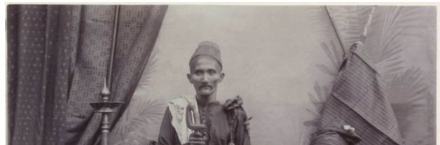
‘Drie Atjehsche oeléëbalangs in verschillende klederdrachten’, ca. 1900.