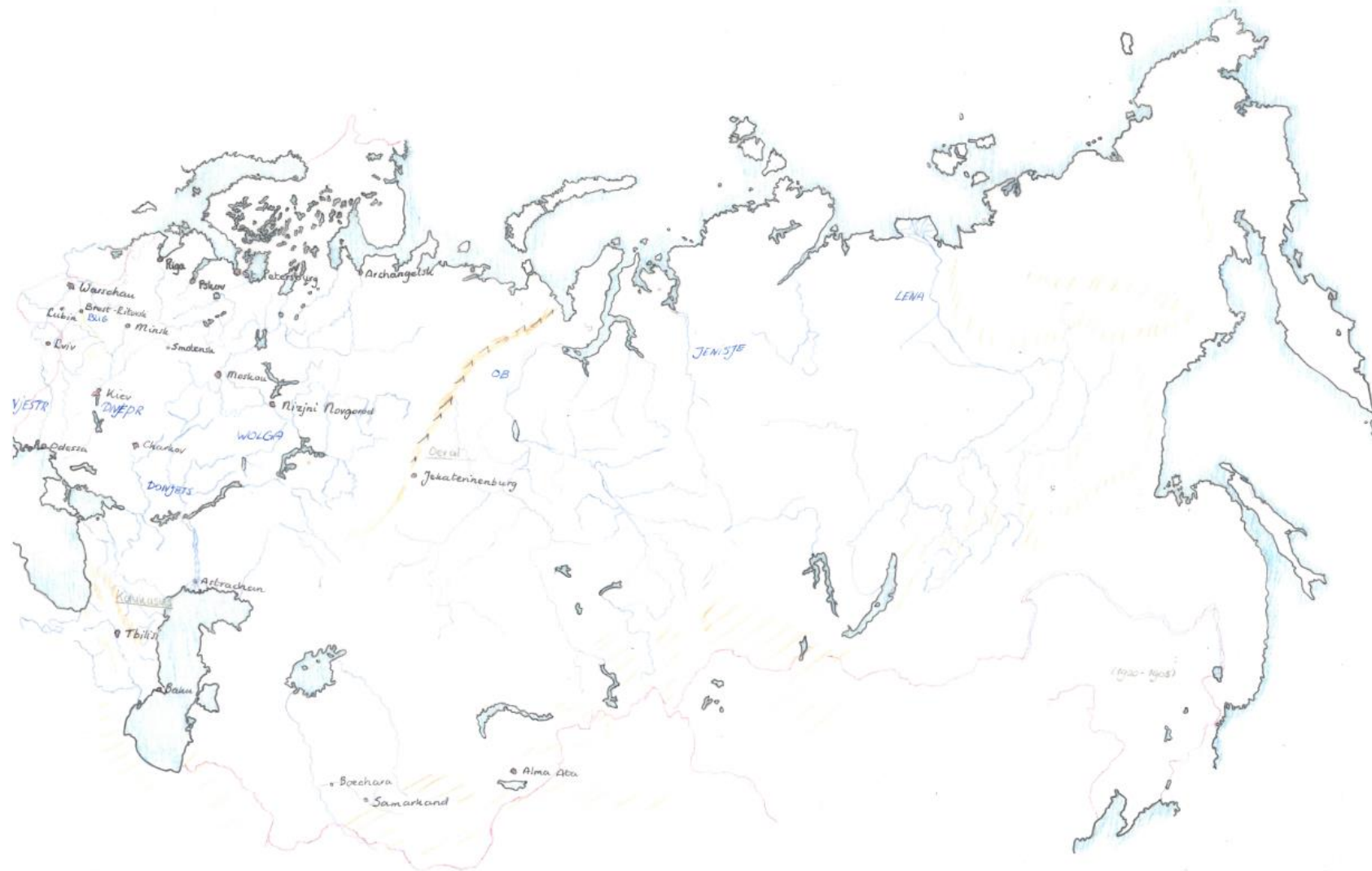
KAART 1 Het Russische rijk omstreeks 1880-1890(met de steden genoemd in het onderzoek)