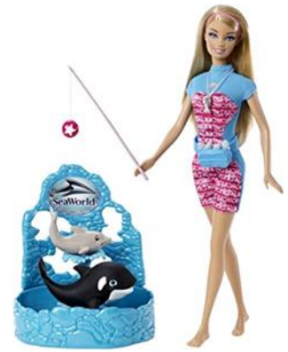
Afbeelding 2: SeaWorld merchandise

Op aandringen van milieuactivisten hebben ook vliegtuigmaatschappijen in 2014 hun banden met SeaWorld verbroken. Onder andere Southwest Airlines, Delta, Air Canada en British Airways hebben besloten niet langer meer met SeaWorld samen te werken (Orlando Weekly, 2019). Themaparktickets en vliegdeals worden vaak met elkaar gecombineerd. Zo'n partnerschap is promotiegericht en beide partijen halen hier voordeel uit. Maar wanneer integriteit op het spel staat, besluiten verscheidene vliegtuigmaatschappijen te stoppen met hun partnerschap met SeaWorld. Redenen voor deze institutionele verandering, zijn de groeiende zorgen over het welzijn van de zeedieren, mede ontstaan door Blackfish (LA Times, 2014). British Airways gaf aan niet langer attracties te promoten die dieren in gevangenschap houden. SeaWorld Orlando is daar één van.