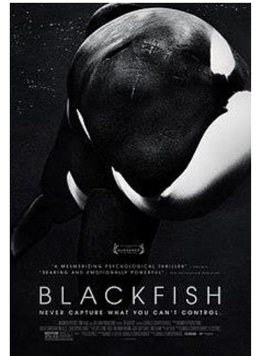
Afbeelding 1: documentaire Blackfish

Het is een lastige opgave om met zekerheid te kunnen aantonen dat bepaalde gevolgen rechtstreeks in verband gebracht mogen worden met de documentaire. Toch zijn een aantal grote zaken wel direct aan de documentaire te relateren en hebben deze een stem gehad in het publieke debat over dolfinaria. Zo zijn de bezoekersaantallen van SeaWorld in het jaar na de release van de documentaire Blackfish met zeventien procent gedaald (Gander, 2014). Eveneens daalde de winst, met maar liefst tachtig procent.