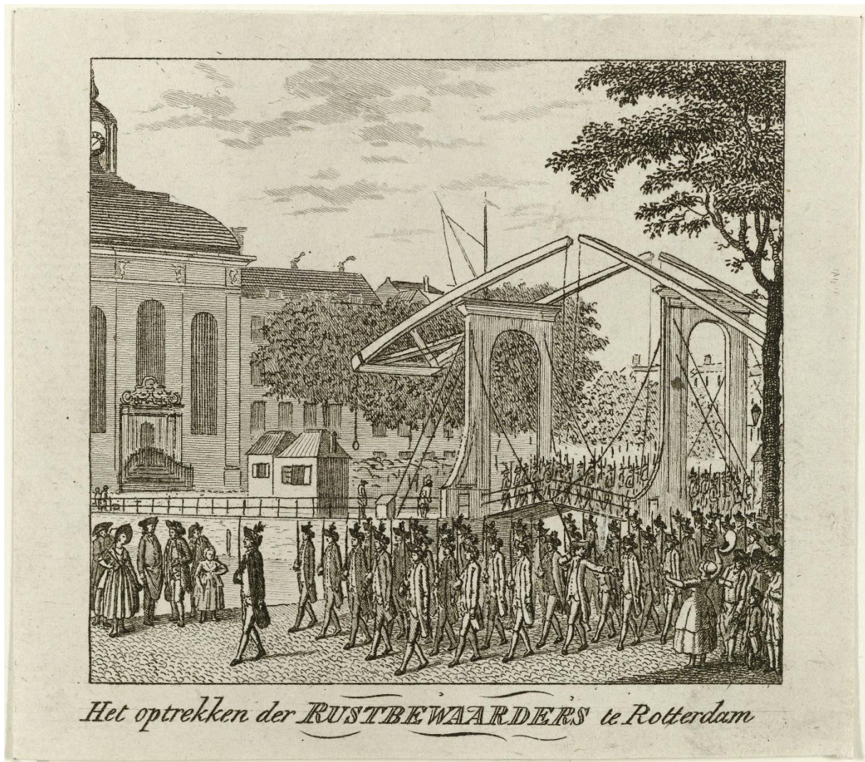
Afbeelding 1: Rustbewaarders marcheren door Rotterdam [ca. 1787]. Rijksmuseum, RP-P-AO-13-19, h 98 mm x b 111 mm.

Jaarboeken echter alleen uit een sabel, een Oranjekarde en een groene tak op de hoed, wat wordt bevestigd door een anonieme prent waarop de rustbewaarders staan afgebeeld (afbeelding 1). Een prent van de orangistische boekverkoper Nicolaas Cornel geeft de burgerwacht echter met musketten weer (afbeelding 2). Deze al dan niet met geweren gewapende orangistische burgerwacht genoot de volledige steun van het Rotterdamse stadsbestuur, dat begreep dat het meer onrust dan veiligheid zou veroorzaken als het bleef steunen op de patriotsgezinde schutterij. Een plaatselijke koopman richtte een fonds op waarmee de vrijwillige wachtlopers voor hun moeite konden worden beloond en ontving daarvoor een grote hoeveelheid vrijwillige bijdragen, volgens Jan Hendriksen ook van patriotten, omdat ze De Een-dracht dankbaar zouden zijn voor het voorkomen van plunderingen. 87 In Leiden maakte een