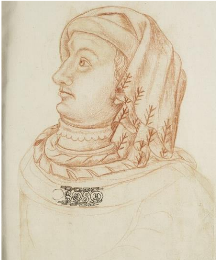
Afbeelding 1: Portret van Jan van Beieren, uit het 16 e -eeuws Recueil d'Arras . (Bibliothèque municipale d'Arras, 0944.2, f30r; afgeb. naar Bibliothèque virtuelle des manuscrits médiévaux < https://bvmc.irht.cnrs.fr/resultRecherche/resultRecherche.php?COMPOSITION_ID=22983 > (6 februari 2020))

pakten de Haydriots deze kans aan om de macht te grijpen. 70 In de vrede van 1395 die op dit conflict volgde moest Jan van Beieren een grotere bevoegdheid van de schepenbank van Luik erkennen. In 1403 kreeg hij het echter weer met de Haydriots aan de stok wat ertoe leidde dat hij de stad moest verlaten. 71 Gedurende een aantal jaren verschanste Jan van Beieren zich in Maastricht, tot hij in 1408 met Bourgondische en Hollandse hulp de Luikse opstandelingen overweldigend versloeg in de slag bij Othée. Vanaf dat moment had hij weinig meer van zijn onderdanen te vrezen. In zijn lange regering als elect van het bisdom Luik heeft Jan van Beieren zich nooit tot priester laten wijden en hield zo de mogelijkheid open voor een wereldlijke carrière.