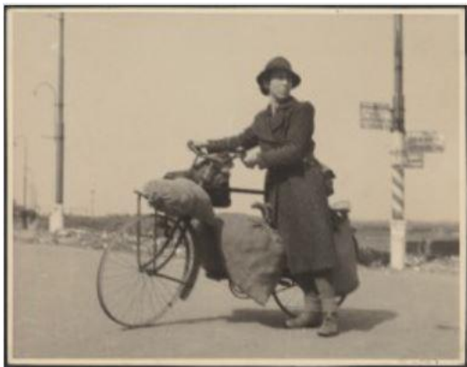
Afbeelding 2: Vrouw met fiets zonder banden op hongertocht.

‘De arme stedelingen die zonder iets zate gevoederd met brood en spek en koffie met echte melk. Dit al om +/- 11 uur dus met dikke buiken naar huis.’ 172