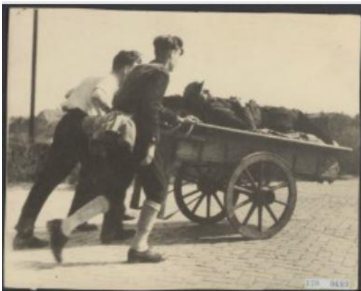
Afbeelding 3: Mannen met handkar op voedseltocht.

De controle bleef tot ver na middernacht staan, waardoor de man om 4 uur ’s ochtends terugging. Hij was al in de kraag gegrepen omdat hij eerder had geprobeerd de zak terug te halen en was op het politiebureau beland. De noodzaak voor de groente was zo groot dat hij dus voor een derde keer ging en dat lukte. ‘Nu ging het door slooten en landen met zijn zak groent, tot bij door een meelijdende boer met een bootje over het breedste water gezet werd, zo kwam hij bemodderd en dood moe aan, bij zijn doodongeruste vrouw, maar met groente.’ 181 De risico’s die de mensen namen om aan voedsel te komen, waren groot.