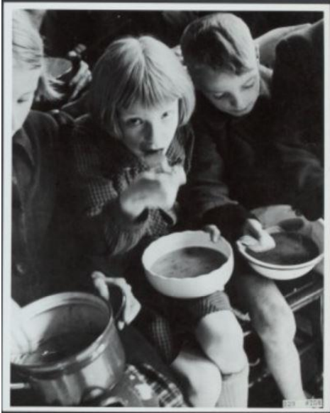
Afbeelding 1: Kinderen eten bij een gaarkeuken tijdens de Hongerwinter.

media en door kunstenaars. 25 Het overheersende beeld van de oorlogsjaren in Nederland hangt voornamelijk samen met de Hongerwinter. Bovendien is er in de 75 jaar sinds de Hongerwinter in Nederland in veel herdenkingen aandacht besteed aan eten. Foto's van hongerige kinderen, zoals op afbeelding 1, zijn veelal gebruikt om de schaarste aan te geven. Dit maakt dat voedsel van de bevrijder wordt geassocieerd met vrijheid, wat het contrast met het laatste oorlogsjaar heel sterk maakt. In dit onderzoek wordt gekeken welke van deze vier hypothesen het meeste opgeld doet.