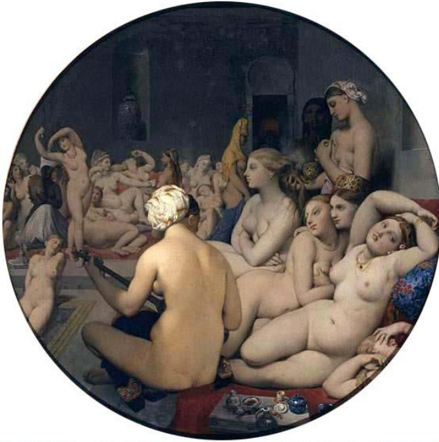
3 ill. Ingres, Jean-Auguste-Dominique, Le Bain turc , [Paris, France], huile sur toile, 108x108 cm, 1862, © Musée du Louvre. Source : Wikimedia

deux femmes noires occupent le fond du tableau : l'une prépare le bain, l'autre coiffe les cheveux d'une femme à la peau claire.