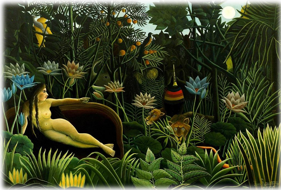
Rousseau, Henri, Le Rêve, [New-York, États-Unis], Huile sur toile, 204,5cm x299cm, 1910, ©Museum of Modern Art . Source : Wikimedia

Mémoire en Études Littéraires (French Track)