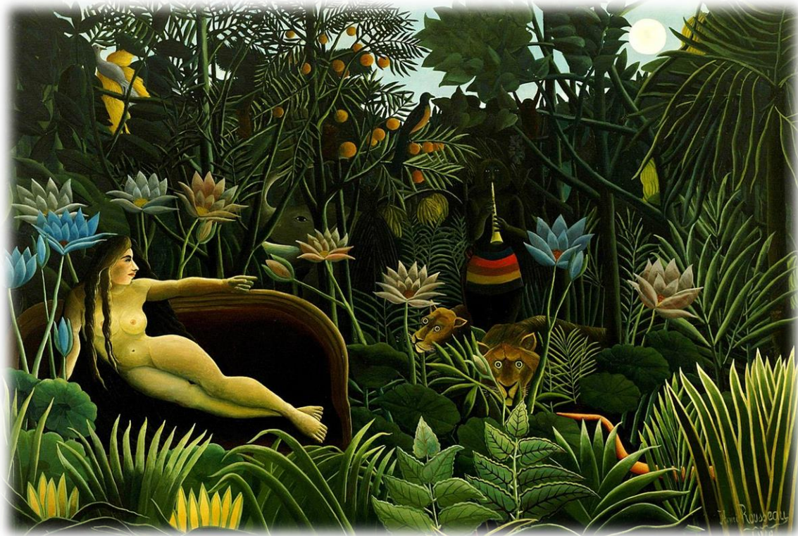
Ill. Rousseau, Henri, Le Rêve , [New-York, États-Unis], Huile sur toile, 204,5cm x299cm, 1910, ©Museum of Modern Art . Source : Wikimedia

La luxuriante nature est représentée à travers cette omniprésence de vert dépeinte avec les nombreux végétaux, arbres fruitiers et fleurs. La gamme chromatique utilisée par Rousseau se décline entre le vert et le bleu donnant l'impression d'être plongé dans un univers complètement différent. C'est aussi le sentiment que l'on retrouve dans la description de la nature telle qu'exprimée par Bernardin de Saint-Pierre :