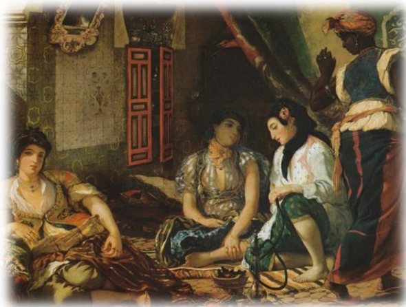
4 ill. Delacroix, Eugène, Femmes d'Alger dans leur appartement , [Paris, France] Huile sur toile, 180x229, 1834, ©Musée du Louvre. Source : Wikimedia

Dans le tableau Les Femmes d'Alger dans leur appartement , la condition sociale précaire de la femme noire se remarque dans la pauvreté de ses vêtements et dans l'absence de bijoux. Le cliché de la femme noire esclave devient une image récurrente qui ne laisse peu de place à une réelle évolution. En d'autres termes, la femme noire n'est pas désirable.