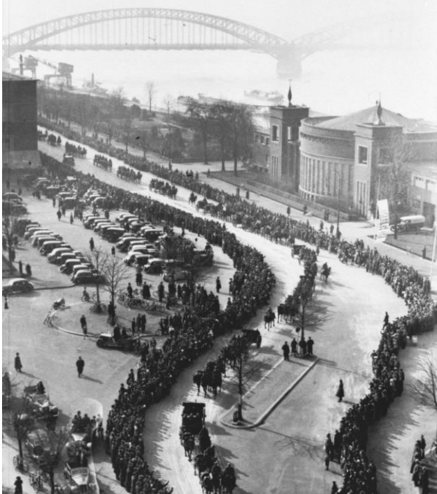
Afb. 2.1: Het Duitse leger trekt Düsseldorf binnen.

eerste viool in Europa wenst te gaan spelen'. 34 Ook schreef hij over de juichstemming in het Rijnland en hoe Duitse soldaten met open armen werden ontvangen. 35