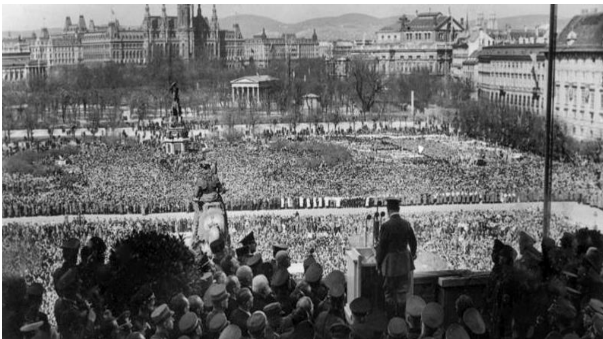
Afb.3.1: Hitler sprak na de Anschluss de menigte in Wenen toe.

Het Rotterdamsch Nieuwsblad reageerde precies zoals de nazi's het graag wilden zien. De krant geloofde oprecht dat het Seyss-Inquart was die de Duitse hulp had ingeschakeld om bloedvergieten te voorkomen. 14 Ook vermeldde en toonde de krant de 'geestdriftige volksmenigtes' en het grootse onthaal van Hitler (afb.3.1). 15 Dat was volgens de krant deels verklaarbaar, omdat het voorheen zwakke Oostenrijk na jaren weer onderdeel van een sterk rijk was. 16 Daarom verweet de Rotterdamse krant Duitsland tot nu toe weinig. De beschuldigende vinger ging vooral naar Genève, de thuishaven van de Volkenbond, die door de krant werd aangespoord veel actiever op te treden met het doen naleven van zijn verplichtingen tegenover zijn leden. 'Als Genève zo blijft, wordt het de hoofdoorzaak van een nieuw Armageddon [eindtijd, TvS].' De drie kranten wezen dus unaniem op de wraak die Duitsland tentoonspreidde naar aanleiding van de gesloten verdragen na de Eerste Wereldoorlog, maar ook het gebrek aan wilskracht van Genève om iets aan die wraakgevoelens en verdragen te doen. Juist een sterke Volkenbond moest zich volgens hen inspannen om Duitsland van een oorlog te weerhouden. 17 Wat hier duidelijk wordt, is dat door de Duitse uitbreiding de kans op incidenten met andere