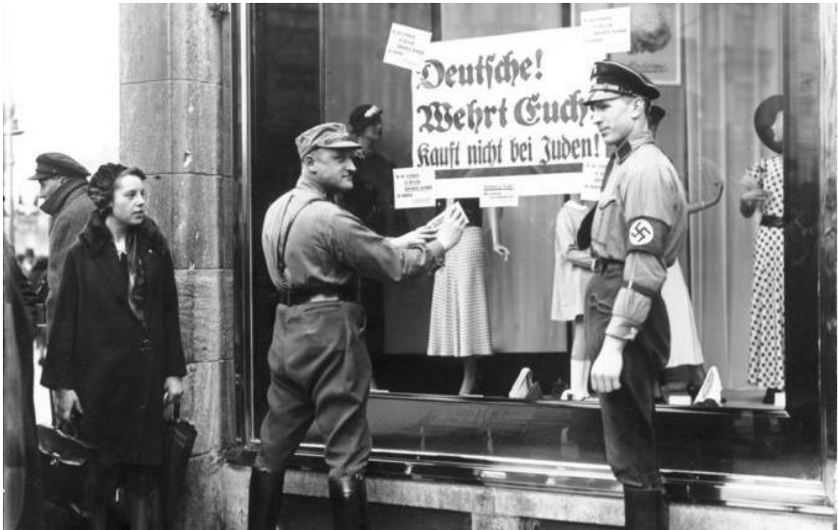
Afb.1.2: 'Koop niet bij Joden!', is op het plakkaat te lezen. SA-leden kijken toe op de nazi-boycot.

studenten op de universiteit. 78 De Duitse regering vond dat de Joden te overheersend waren op hogere maatschappelijke posities. Deze wet moest die scheve verhouding weer recht trekken.