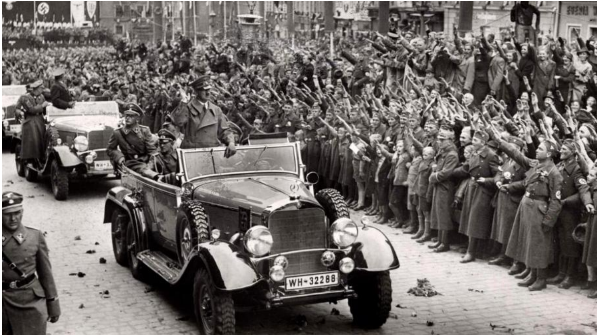
Afb.3.2: Hitler bezoekt onder groot gejuich het Sudetengebied.

Daarbij werden de Duitse soldaten door de inwoners van Sudetenland met gejuich begroet, was te lezen en te zien (afb.3.2). 60