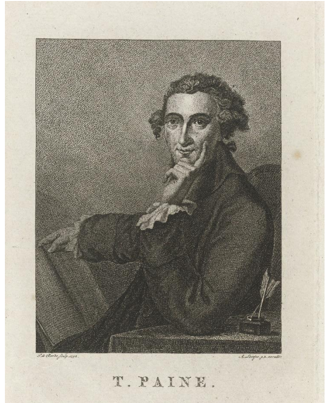
Thomas Paine 1737-1809