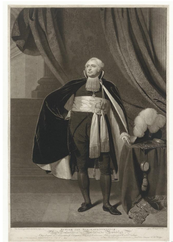
Rutger Jan Schimmelpenninck 1761 – 1825 Rijksmuseum Amsterdam: RP-P-OB-33.858