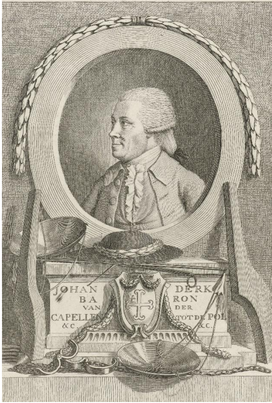
Joan Derk van der Capellen tot den Pol 1741-1784 Rijksmuseum Amsterdam: RP-P-1905-1675X