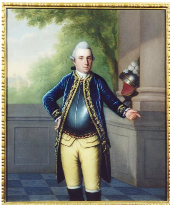
Robert Jasper van der Capellen tot den Marsch 1743 – 1814 Nederlands instituut voor kunstgeschiedenis: 0000139067