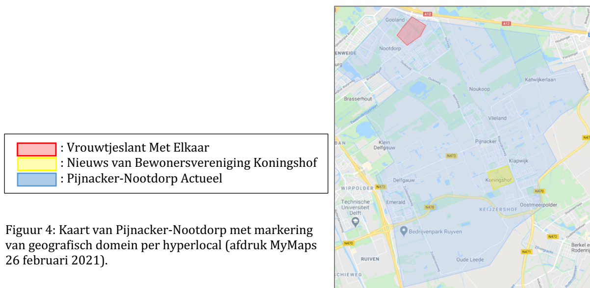
Figuur 4: Kaart van Pijnacker-Nootdorp met markering van geografisch domein per hyperlocal (afdruk MyMaps 26 februari 2021).

Allereerst is Pijnacker-Nootdorp Actueel de hyperlocal die zich focust op de hele gemeente. Deze hyperlocal is actief via een eigen website en plaatst hier dagelijks nieuwsberichten. Nieuws van Bewonersvereniging Koningshof is ook actief op een eigen website. Maar deze hyperlocal focust zich alleen op nieuws dat betrekking heeft op de wijk Koningshof in Pijnacker en plaatst ongeveer wekelijks tot maandelijks nieuwsberichten op de website. Daarnaast heeft Bewonersvereniging Koningshof ook een wijkblad dat een keer in de drie maanden wordt verspreid in de wijk en op de site. Tot slot is Vrouwtjeslant Met Elkaar de hyperlocal in de wijk Vrouwtjeslant in Nootdorp. Deze hyperlocal is actief op het sociale mediaplatform Facebook en post hier ongeveer wekelijks een bericht op. Daarnaast heeft Vrouwtjeslant Met Elkaar sinds februari 2020 ook de nieuwsbrief 'Het groene blaadje'. Deze nieuwsbrief wordt zowel via print in de wijk verspreid als digitaal via de Facebookpagina verspreid. In figuur 4 is te zien waar welke hyperlocal 'opereert' in de gemeente.