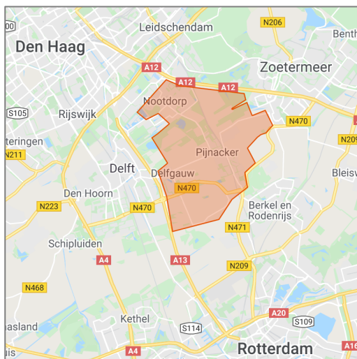
Figuur 2: Kaart Pijnacker-Nootdorp en omgeving (afdruk MyMaps 27 februari 2021).

13,1 procent van de inwoners heeft daarnaast een Niet-Westerse migratieachtergrond, wat iets lager ligt dan het landelijke percentage (13,7%). Van de huishoudens in Pijnacker-Nootdorp maakt 15,7 procent gebruik van voorzieningen in sociaal domein, dat is lager dan het gemiddelde in Nederland (22,6%). En tot slot heeft 2,3 procent van de huishoudens in Pijnacker-Nootdorp een bijstandsuitkering, dat ook lager is dan het gemiddelde in Nederland (5,0%) (Pijnacker-Nootdorp in Cijfers, z.d.).