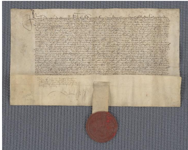
Figuur 4: Volmacht aan George Schenck van Tautenburg. 107

Zo staat er onder andere: ‘ende oock tot extirpatie der vermaledyder Luteriaensche ende anderen heretycquen secten, die in den keyserryck ende andere syne landen wesen mochten’. 108 Gedurende deze tijd, het begin van de Reformatie, ontstonden meer en meer conflicten over religie, iets wat in deze scriptie eigenlijk nog niet aan bod is gekomen. De Habsburgers pleitten voor het katholicisme. De overgrote meerderheid van de Nederlandse bevolking was ook nog katholiek en dat wilden de Habsburgers zo houden. Vandaar dat geprobeerd werd om met de centralisatie van de Nederlanden opkomende protestantse sympathieën en praktijken te ‘extirperen’. Het protestantisme werd hierdoor ook maar door kleine groepjes individuen beleden. Onder het bestuur van Karel V en later ook onder Philips II was steeds minder ruimte voor tolerantie richting de protestantse bevolking. 109