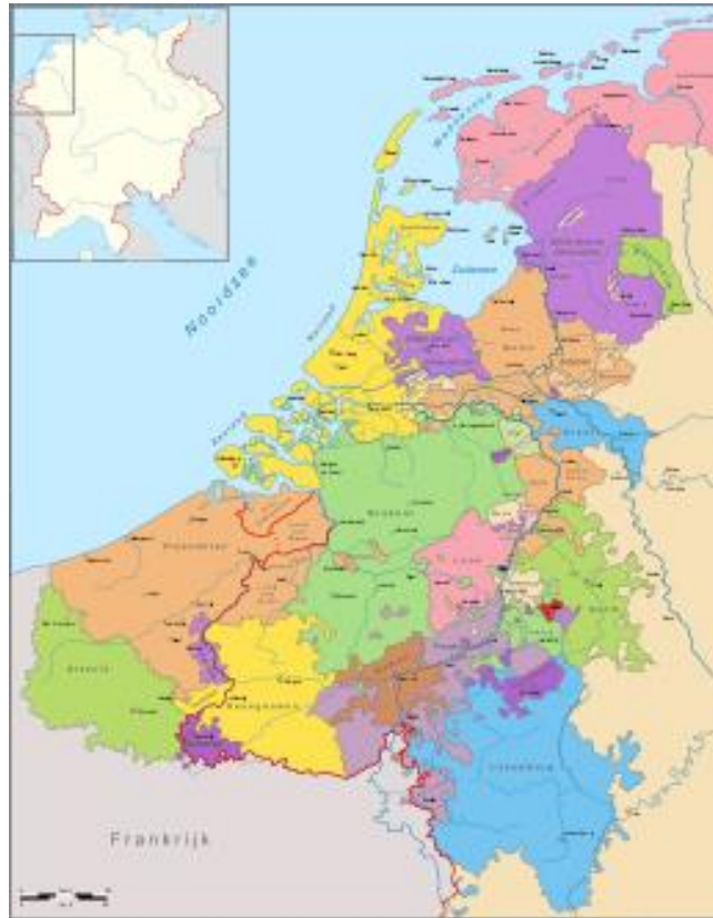
Figuur 1: De Nederlanden omstreeks 1350 met het Sticht in het paars. 23

wel formeel door de keizer met hun goederen en rechten belenen. 24 Deze rijksvorsten werden vanaf eind twaalfde eeuw, na een ‘leenrechtelijke organisatie’, aangeduid als geestelijke en wereldlijke heersers die onder direct gezag stonden van de keizer. Zo had de bisschop van het Sticht als enige rijksvorst van de Noordelijke Nederlanden niet alleen wereldlijk gezag, maar ook geestelijk gezag, aangezien het Sticht als enige der Noord-Nederlandse gewesten beschikte over een bisschopszetel. 25 Immink spreekt over een supra-grafelijke macht waarbij de bisschop handelde vanuit het rijksbelang, dus uit naam en ten gunste van de keizer. 26 De kerkvorsten hadden bovendien hun landsheerlijke rechten, waaronder dus de wereldlijke macht (temporaliteit), direct verkregen van de keizer. Met name die wereldlijk macht is relevant m.b.t. deze scriptie om kort uit te lichten.