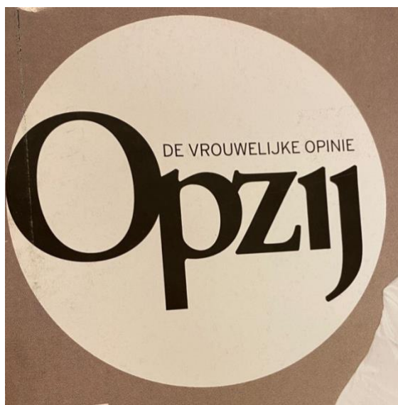
Figuur 2 Het logo van Opzij sinds de februari 2009. “Feministisch maandblad” staat niet langer in het logo.

Dat er wordt gekozen voor de ondertitel “de vrouwelijke opinie” onderschrijft het label normatief feminisme. Opzij vertegenwoordigt blijkbaar de norm en weet wat vrouwen vinden. In feministische golf die meer nog dan zijn voorganger bestaat uit een veelvoud aan stemmen is de keuze van deze ondertitel problematisch te noemen. Opzij presenteert zich hiermee als ijkpunt van de vrouwenbeweging, terwijl deze meer dan ooit diffuus is geworden. Waar Opzij in de tweede feministische golf de liberale stroming van het feminisme vertegenwoordigde, bedient zij ook nu slechts een deel van het publiek. In alle feministische golven bestaat er niet zoiets als “het” feminisme en zo is ook “de” vrouwelijke opinie een illusie. Door te stellen dat deze wel zou bestaan, neemt Opzij stelling in op een manier die niet past bij het pluralisme van de derde feministische golf. Uit het vorige hoofdstuk is gebleken dat steeds meer vrouwen zich niet langer herkennen in het tijdschrift en op zoek gaan naar andere platforms om hun activisme te uiten.