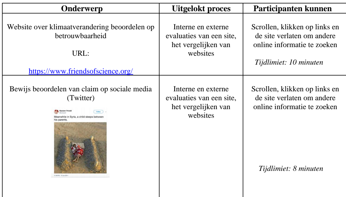
Tabel 1: Opdrachten experiment

In lijn met onderzoek van Wineburg en McGrew (2016; 2017) zijn soortgelijke opdrachten geformuleerd. De focus ligt op het verifiëren van digitale bronnen over sociale en politieke kwesties om civic online reasoning 1 te bestuderen en te kijken in hoeverre overtuigingen meespelen bij verificatie van webinformatie. Tevens is het met deze opdrachten mogelijk vast te leggen welke verificatiestrategie – vertical reading en/of lateral reading – factcheckers/informatieprofessionals en journalistiekstudenten toepassen. Respondenten voeren de volgende taken uit: