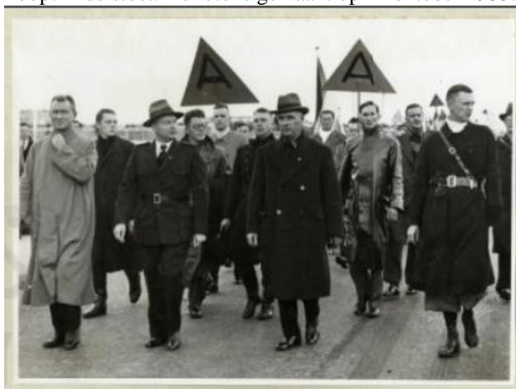
Afbeelding 7. Foto van de Landdag van de NSB in Den Haag, waar Anton Mussert voorop loopt in de stoet. De foto is gemaakt op 12 oktober 1935.