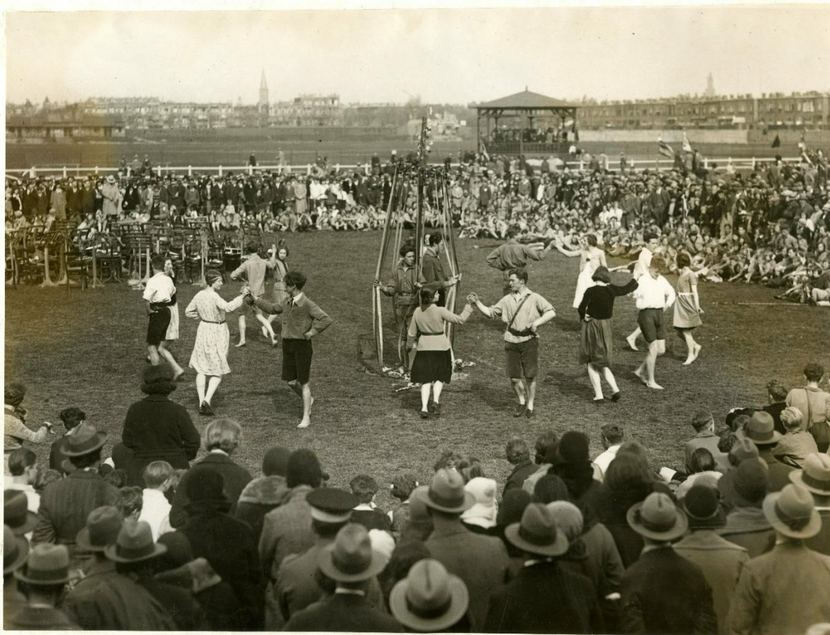
Afbeelding 6. Foto van een bijeenkomst van de SDAP op 1 mei 1931 op Houtrust waar de AJC een dans opvoerde. De maker is onbekend.