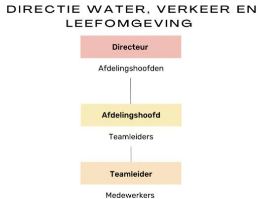
Figuur 1. Leiderschapsketen

De organisatie waarbij dit onderzoek wordt uitgevoerd is Rijkswaterstaat. Het onderzoek zal worden gehouden binnen de afdeling Water, Verkeer en Leefomgeving. De leiderschapsketen van een van de vier directeuren wordt in dit onderzoek gevolgd. Dit houdt in dat naast de directeur, ook drie afdelingshoofden onder de directeur en de teamleiders onder de afdelingshoofden worden geïnterviewd over hun intended inclusieve leiderschap en het perceived inclusie leiderschap van hun leidinggevende (zie figuur 1).