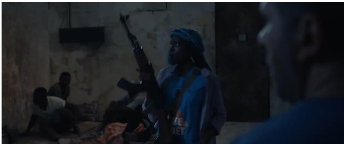
Figura 3.7 Cattura di schermata. Idjaba durante la ribellione nella prigione. Tolo Tolo (2020).

Nonostante Idjaba venga presentata come un oggetto di desiderio, il personaggio sembra distanziarsi dallo stereotipo della Venere Nera, essendo estremamente indipendente e forte. Lei non si appoggia a Checco, non fa finta di ricambiare i suoi sentimenti per arrivare in Italia, anzi nel momento in cui affida Doudou a Checco decide di tornare nel suo paese per combattere. La scelta di affidare il bimbo a Checco, che in questo momento scopriamo non è suo, ma di una sua compatriota, è un ribalto dello stereotipo della madre africana alla ricerca di una vita migliore per lei e suo figlio. Allo stesso tempo, però, Idjba fa uso della sua allure quando ne ha bisogno, ad esempio quando si trova nella prigione a Tripoli insieme a Checco e Doudou. Quando due guardie la avvicinano, lei fa finta di essere interessata e va con loro, solo per poi sopraffarli e guidare una ribellione nella prigione ed è finalmente raffigurata come il forte soldato che è (Fig. 3.7).