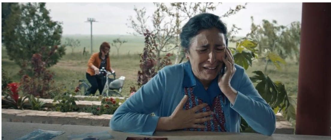
Figura 3.8 Cattura di schermata. La madre al telefono con Checco dopo l'insurrezione in Kenya. Tolo Tolo (2020).

come la burocrazia ha rovinato i loro piani di business, nonostante la corruzione del sistema, i quali rappresentano lo stereotipo dell'italiano corrotto che vuole prendere delle scorciatoie a tutti i costi e rimane subito quando questo non funziona. Tra questi etno-tipi dell'italiano si hanno anche la madre di Checco, la quale incarna lo stereotipo della madre italiana, sempre preoccupata per il figlio e molto protettiva (Fig. 3.8), e Luigi Gramegna, il quale passa da essere un cameriere al sushi bar di Checco, ad un ministro, al presidente del consiglio, diventando una parodia del sistema politico italiano.