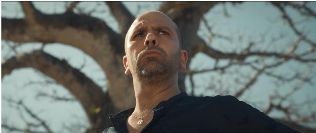
Figura 3.3 Cattura di schermata. Checco mimica il Duce. Tolo Tolo (2020).

tipici italiani, rendendo la situazione ancor più comica. Infatti, l'offerta sottolinea visualmente, attraverso l'uso di oggetti di scena, il fatto che il compito di colmare il divario culturale ricada sugli africani, e non sull'ospite bianco.