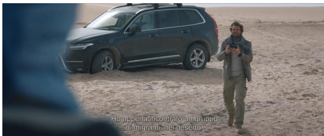
Figura 3.6 Cattura di schermata. Primo incontro con Alexandre. Tolo Tolo (2020).

Qualcosa va detto inoltre sul giornalista francese, il quale si presenta come un grande umanitario, ma alla fine si rivela essere "un odioso narciso radical-chic che abbandona i suoi compagni di viaggio in un carcere libico" (Canova 8). Vestito in garbo che ricorda leggermente quello di un esploratore di altri tempi, Alexandre rappresenta "una presa in giro di alcuni giornalisti narcisi che si incontrano negli scenari di guerra e non solo" (Raimo e Scego), interessato soltanto a trovare la prossima storia da vendere e la sua immagine (Fig. 3.6).