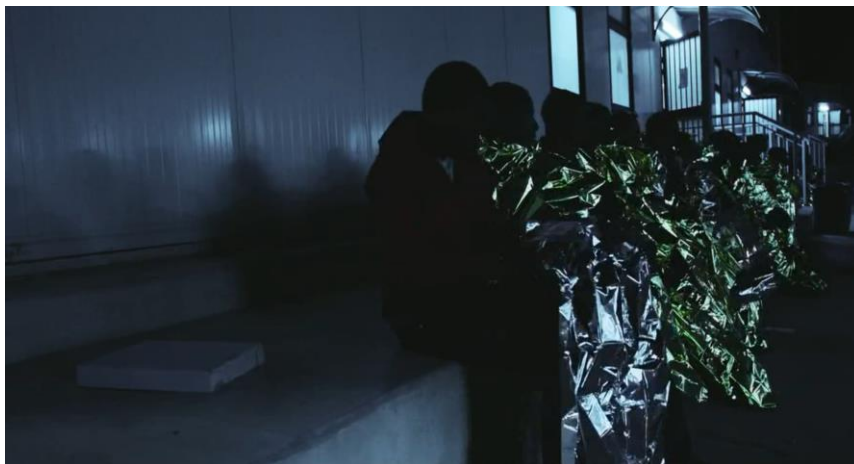
Figura 2.4 Cattura di schermata. Gruppo di migranti arrivati al Centro di Accoglienza. Fuocoammare (2016).

Tuttavia mentre Rosi cerca di allontanarsi dalle immagini di miserie e sofferenza che dominano i giornali in quegli anni e mostrare una realtà diversa da quella di vittimizzazione, non ci riesce del tutto (Fig. 2.4). Mostrando queste immagini e “the harsh reality of the people tormented by the journey, Rosi accentuates even more the bare life of the migrants, highlighting their condition of absolute exposure to the power of the dominant society and of the spectator” (Bagnasco 31). Rosi, esplorando questo senso di ‘altro’, cattura con le telecamere il più delle volte grandi gruppi di migranti che perdono, nella composizione di scene scure ed omogenee, la loro individualità e la loro umanità, diventando semplicemente corpi.