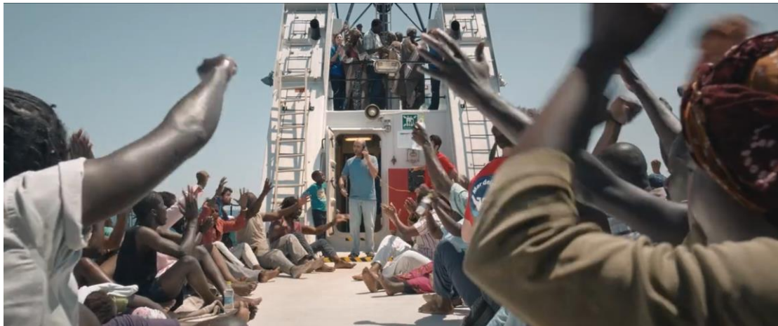
Figura 3.9 Cattura di schermata. I migranti applaudono Checco. Tolo Tolo (2020).

finalmente Checco stia cambiando e si stia rendendo conto della situazione in cui tutti loro si trovano (Fig. 3.9). Ma non passa nemmeno un secondo che Checco dimostra il contrario, poiché quando scopre che è al telefono con il porto di Marina di Vibo Valentia dice rivolgendosi ai migranti e ai volontari della Ong “ma no, ragazzi torniamo in Africa [...] Un po’ di dignità” ( Tolo Tolo 1:15:21-1:15:30).