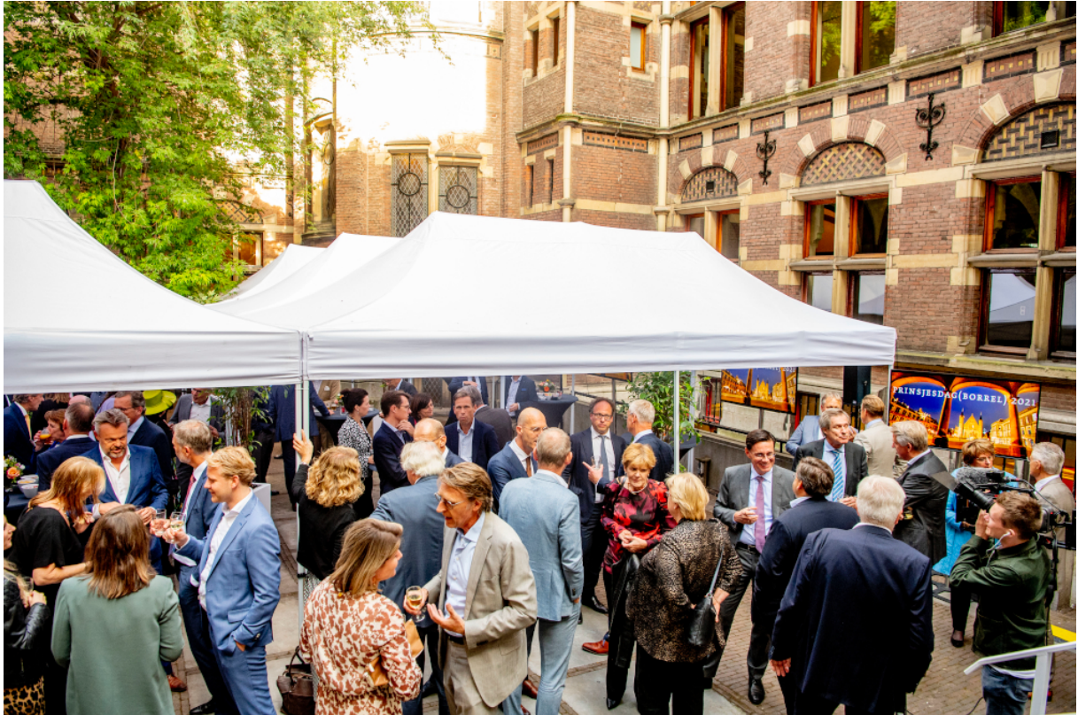
Prinsjesdagborrel VNO-NCW (Utrecht, 2021)

Een onderzoek naar de verschillen tussen Kamerleden en hun responsiviteit voor belangenbehartigers