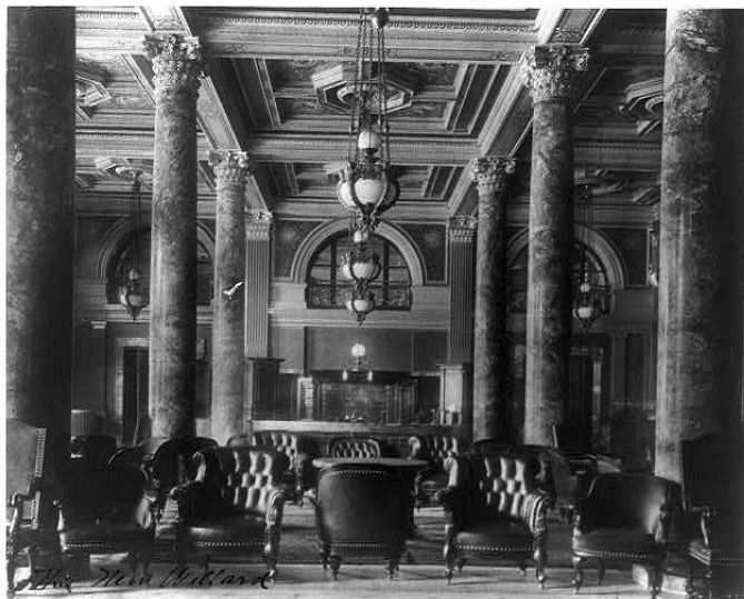
De Willard Hotel lobby