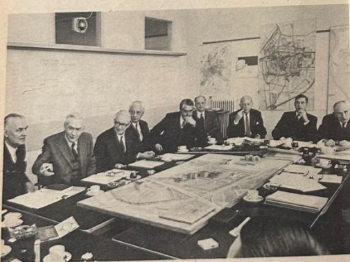
Bespreking van bouwzaken aan de hand van kaarten, statistieken en maquettes