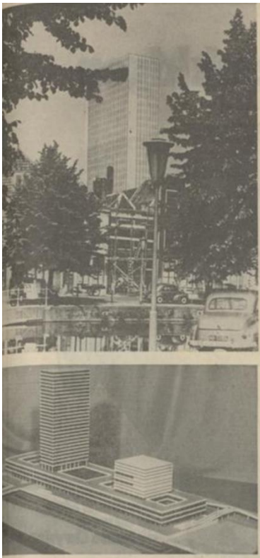
Figuur 3, Maquette en illustratie van het eerste plan van Zanstra voor het nieuwe faculteitsgebouw uit 1968.