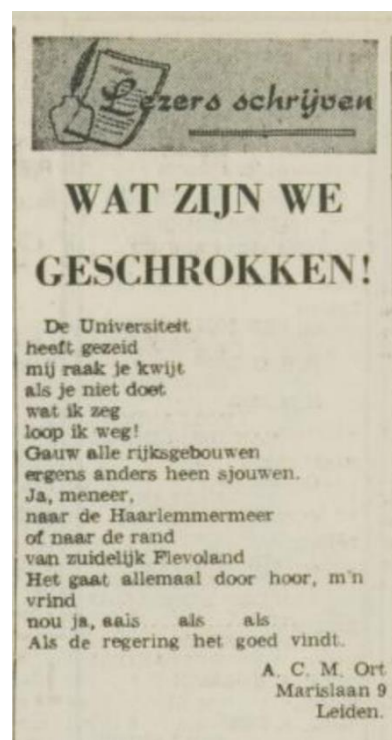
Figuur 2, ingezonden brief op 20 mei 1968 waarin op ludieke wijze de draak wordt gestoken met het argument van de Universiteit dat zij vertrekken naar een andere stad als zij niet de ruimte in de Leidse binnenstad krijgen.