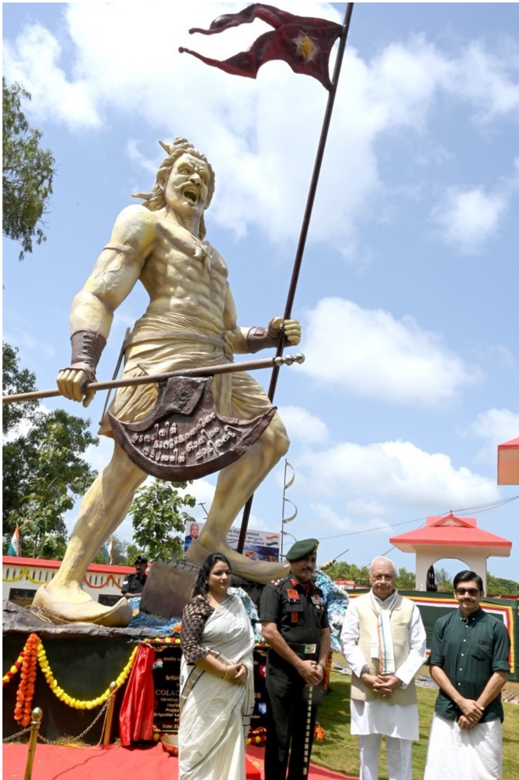
Afbeelding 1: Het Colachel Victory Warrior Statue dat op 23 juli 2023 werd onthuld ter nagedachtenis aan de overwinning van Travancore op de VOC tijdens de Slag om Colachel in 1741. De man in het wit (tweede persoon van rechts) is de gouverneur van Kerala, Arif Mohammed Khan, anoniem (2023). X, Kerala Governor, https://x.com/KeralaGovernor/status/1683168786516697089 (geraadpleegd 5 juni 2024).