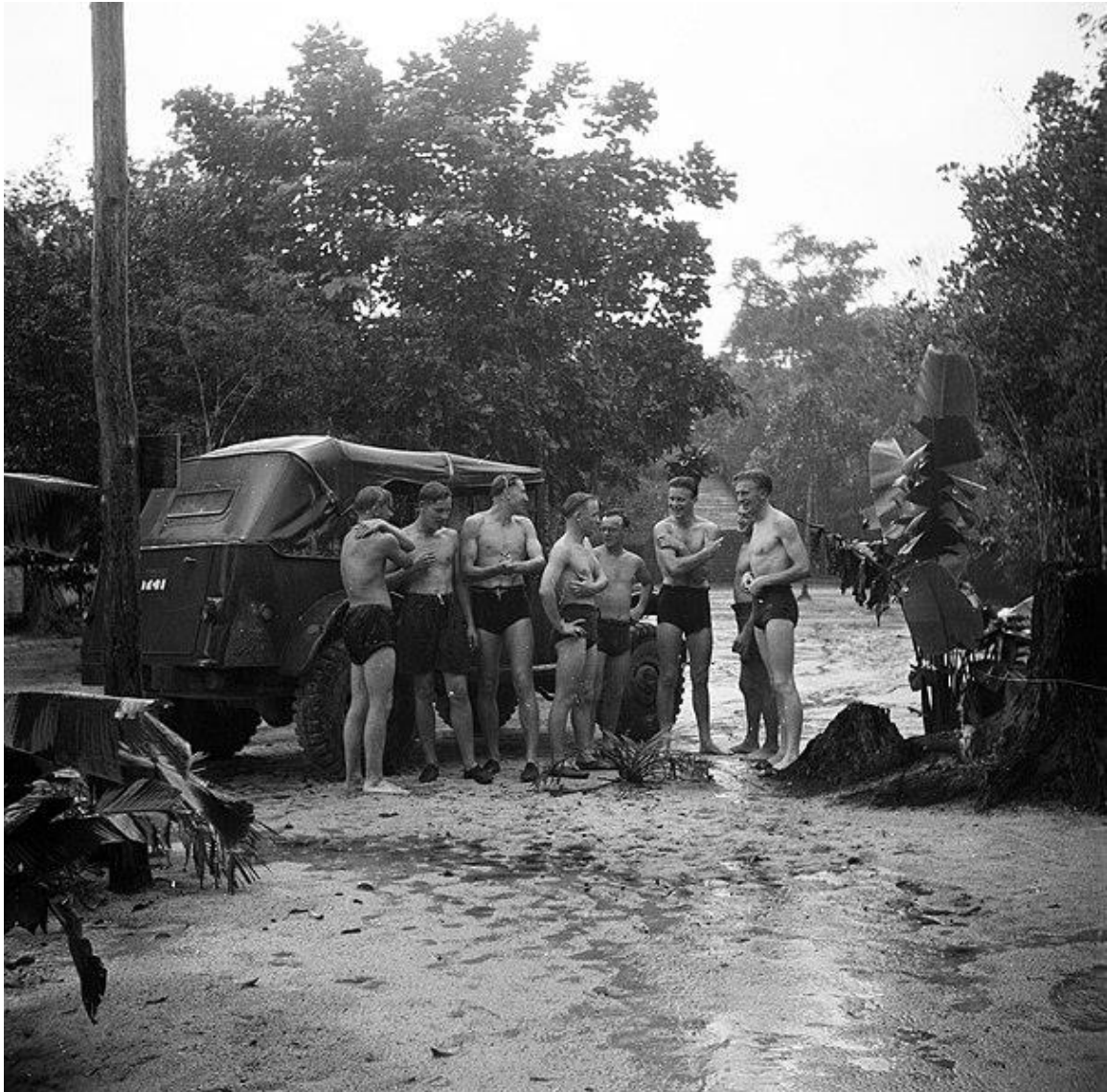
Figuur 7: Militairen in een tropische regenbui bij hun kampement te Zanderij (Poll, 1947).

betekende de komst van de Amerikanen ook investeringen in de verdedigingswerken, vliegvelden en andere infrastructuur in het gebied (Netwerk Oorlogsbronnen, 2021). Zo werd het vliegveld op Zanderij uitgebreid tot militaire basis. Figuur 7 laat militairen bij de Zanderij zien tijdens een vrije middag. Daarbij zorgde de oorlogsindustrie voor extra werkgelegenheid en een opleving in de economie van Suriname. Nederland speelde daarin, zoals in Hoofdstuk 1 uiteengezet, niet de hoofdrol.