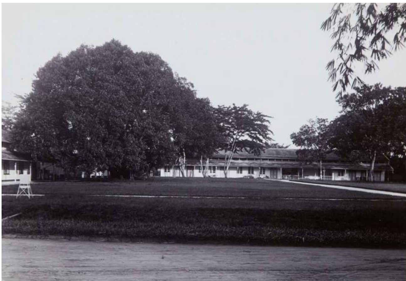
Figuur 6: Het landbouwproefstation, ergens tussen 1904 en 1937 (Curiel, z.d.).