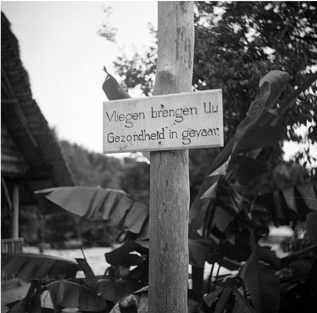
Figuur 10: Waarschuwbord bij het militaire kampement te Zanderij (Poll, 1947).

Uit mijn onderzoek is gebleken dat de collecties commerciële en wetenschappelijke functies hebben gehad. Een deel van de collectie is in eerste instantie verzameld voor onderzoek naar gewassen- en landbouwoptimalisatie, en een later deel van de collectie is verzameld met als doel om de biodiversiteit van Suriname vast te leggen en bij te houden. Na aankomst in Nederland zijn vrijwel alle collecties alleen gebruikt voor wetenschappelijk onderzoek, en niet voor tentoonstellingen in natuurhistorische musea. Een enkel object is mogelijk gebruikt als achtergrondobject voor een diorama op de werelddtentoonstelling (Naturalis Bioportal, specimen ZMA.AVES.64860).