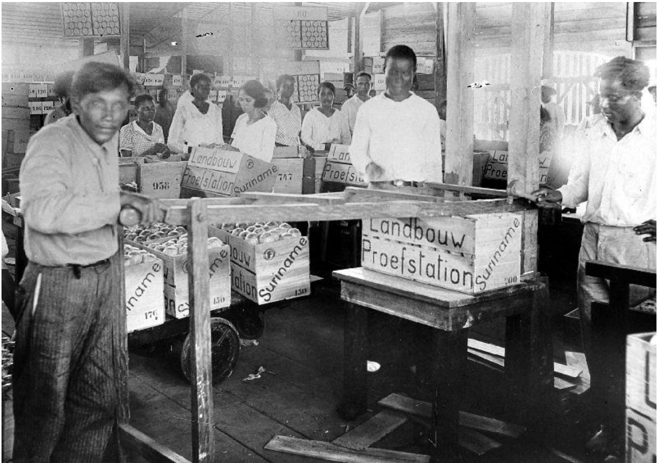
Figuur 4: Leerlingen van het Maria Patronaat vullen dozen met sinaasappels om naar Nederland te verscheppen op het landbouwproefstation (Nationaal Museum van Wereldculturen, 1931).