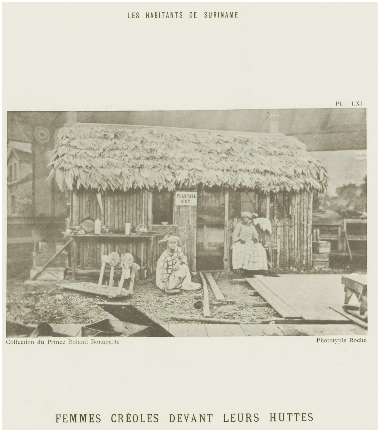
Figuur 1: Surinaamse vrouwen voor een hut op de Wereldtentoonstelling in Amsterdam, 1883 (Quantin, 1884).

kwam er wel een interpretatie van Surinaamse cultuur: Een circustent met omtrek van driehonderd meter, omhuld met beschilderde doeken met taferelen zoals het gouvernementsgebouw, plantages, en natuur. (Schuurmans, 2013, p. 59) Zoals zichtbaar in Figuur 1 werden met deze natuurschetsen als achtergrond inheemse Surinamers, Marrons en Hindoestanen tentoongesteld aan de bezoekers.