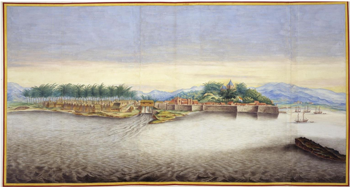
Afb. 6. Gezicht op Malacca, Johannes Vingboons 1665-1668. Deze afbeelding is een kopie van een afbeelding die kort na de verovering van de stad is gemaakt. Te zien zijn de grote muren die de stad moesten beschermen tegen belegeringen. Via: