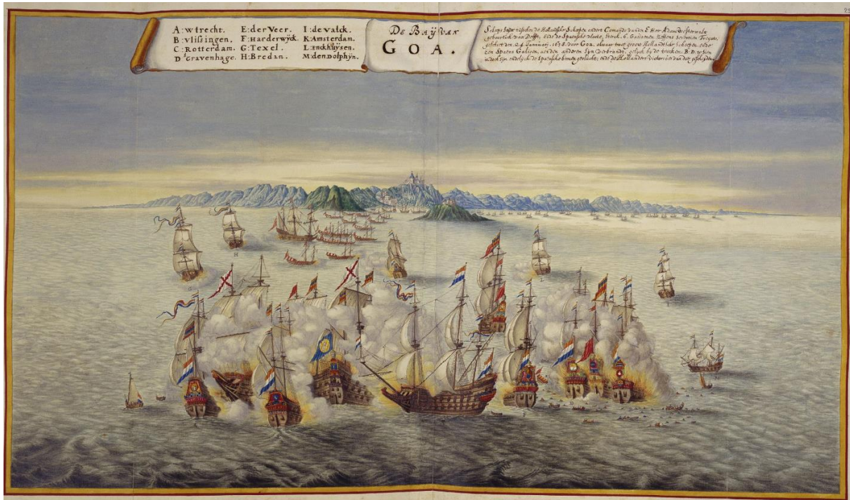
Afb. 3. Zeeslag bij Goa tussen de Nederlandse en de Portugese vloot in 1638, Johannes Vingboons, 1665 – 1668. Achter het krijgsgeweld is het karakteristieke eiland voor de baai van Goa te zien.

De eerste stap in het offensief van Van Diemen was een blokkade van de Portugese hoofdstad Goa. Deze begon in 1637 en duurde tot 1644. 132 In deze periode werden in totaal negen vloten uitgezonden om de stad via zee af te sluiten van de buitenwereld. Zo konden de Portugezen geen versterkingen meer sturen naar hun verschillende factorijen en konden schepen vanuit Lissabon de stad niet meer bereiken. Deze blokkade was logistiek moeilijk, maar functioneerde door het wisselen van de vloot. Naast de jaarlijkse nieuwe vloten, wisselden de schepen binnen de vloten elkaar af. Dat werd mogelijk door de factorij Wingurla, ongeveer 50 kilometer verderop, waar de schepen vers water en brandhout konden verzamelen.