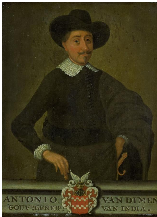
Afb. 1. Portret van Antonio van Diemen (1593-1645). Anoniem, 1750-1800.