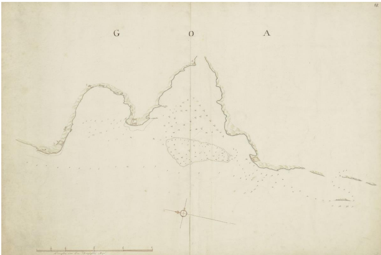
Afb. 4. Kaart van de baai en kust van Goa, Isaac de Graaff, 1695.

zestien schepen naar buiten voeren om de blokkade aan te vallen of in 1641, toen zij probeerden een vredesverdrag te sluiten met het volk van Bijapur, in wier gebied de VOC hun factorij Wingurla hielden – maar het mocht niet baten. Ook een aangeboden wapenstilstand naar aanleiding van het scheiden van de Spaanse en Portugese kronen in 1641 kon de blokkade niet doorbreken. 133 Pas na het sluiten van het tienjarig bestand in 1644 werd besloten om af te zien van het sturen van nieuwe vloten. Op dat moment was het echter al te laat: door de blokkade van de stad had de compagnie de Portugese macht in het gebied fors weten te verzwakken. De inkomsten van de handel daalden fors en de Portugezen waren door de blokkade niet in staat om assistentie te bieden aan Ceylon en Malakka toen die werden aangevallen door de Nederlanders. 134