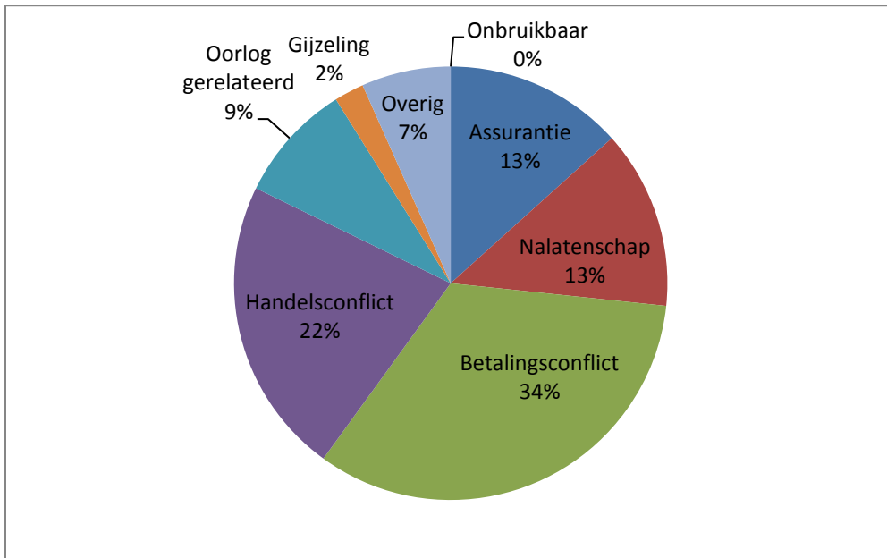
Grafiek II: Sefarim – niet Sefardim.